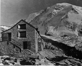
Belemphütte und Lyskamm