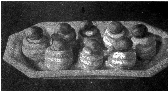
Fischfilets mit Champignons

das Blauwerden verursacht, nicht abgenommen wird. Dann werden sie gewaschen und mit Essig übergossen und zugedeckt eine halbe Stunde stehen gelassen, wodurch sie blau werden. Dann gibt man die Forellen in kochendes Salzwasser mit etwas Essig und lässt sie 6 bis 12 Minuten auf kleiner Flamme ziehen. Dann werden sie sorgfältig herausgehoben und auf einer Platte hübsch angerichtet. Dazu serviert man ausgelassene frische Butter (so man hat) oder eine holländische Sauce und Salzkartoffeln.