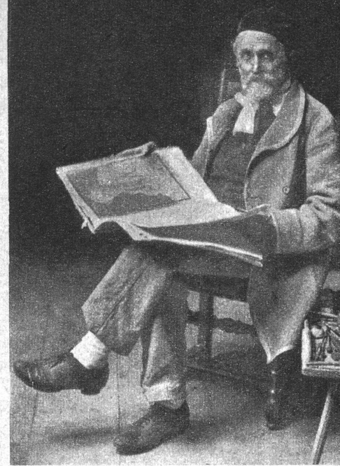
Kunstmaler Albert Anker in seinem Atelier in Ins

Es git alleweg mit viel Möntschen i dr Schwyz, wo no nie es Ankerbild gseh un bewundered häi. Mänge het si zwar nid lang drum kümmered, vo wäm dass das schöne Bild sig. Es hed ihm äifach gfallt, un es hed ihn uf irdig ani Art a öppis Liebs u Schöns u Guets bsinnt vo frücher albe, es hed ihn ghäimel un er hed gmänt, das sygi Lüt do druff, wo-n-er ganz sicher o scho gseh oder begegnet häig. Un wenn er de zlescht doch no dr Name Anker erlickt het, so hed er glych nit grad vil drmit gwüsst azfo. Er het jo nit gwüsst, was das für ne Möntsch isch, wenn u wo dass er gläbt het, soweni dass er hält chönne wüsse, dass dr Moler Anker syni mätschte Modäll im äigete Häimetdorf gfunge het, wo mit