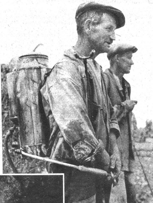
Oben: Die Inser Reben sind unter Kennern berühmt. Anstrengend ist die Pflege und nicht ungefährlich das Spritzen mit dem Kupfervitriol, weshalb die Männer dazu alte Ueberkleider benutzen und meist fleissig rauchen. Links: Das letzte Strohdach im «Bärnbiet» stand in Ins. Rechts: Der Wagenschmied hat immer alle Hände voll zu tun. Hier macht er in der Maschine einen Reifen für ein Rad