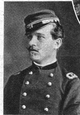
Links: Artillerie-Oberleutnant Wille im Jahre 1872

zu erziehen, sie vor Schlendrian zu bewahren. Dabei hat er auch immer vor der gedankenlosen Uebernahme ausländischer Vorbilder und vor oberflächlicher Vielseitigkeit in der Ausbildung gewarnt.