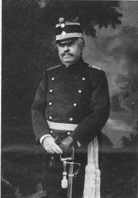
General Ulrich Wille, wie ihn alle diejenigen in Erinnerung haben, die den ersten Weltkrieg miterlebten

Doch eine jähe Schlucht sperrte schliesslich seinen Weg. Das Band brach