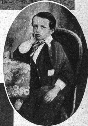
Oben: Ulrich Wille als vierjähriger Knabe

Diesem Glauben ist er Zeit seines Lebens treu geblieben und hat seine ganze Tätigkeit in allen seinen Stellungen, in Wort und Schrift, die er meisterhaft beherrschte, darauf eingestellt, unsere Milizarmee zur Kriegstüchtigkeit