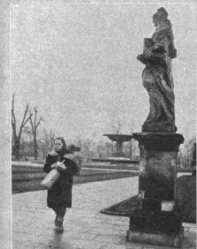
Eine Bäuerin bringt Ziegenmilch in die Stadt.

leidiger nur durch tagelanges Artilleriefeuer aus allen Rohren zu brechen vermochten. Der zweiten Vernichtungsgestappe fielen das Judenviertel, das Ghetto, und deren 400.000 Insassen, die sich nicht einfach wie Vieh in die Schlachthöfe von Auschwitz hatten transportieren lassen, im Jahr 1943 zum Opfer. Die Rache der Machtmenschen kannte keine Grenzen. Eine Wüsterei von drei Quadratkilometern Ausdehnung zeugt von ihrem barbarischen Wüten, das seinesgleichen seit der Zerstörung von Jerusalem durch Titus nie mehr gekannt hat. Doch damit noch nicht genug: im Sommer 1944, als die in Auflösung begriffenen deutschen Armeen geschlagen aus Russland nach Westen zurückfluteten und die Truppen der Roten Armee vor Warschau standen, erhob sich die Bevölkerung, um das verhasste Joch der Fremdherrschaft aus eigener Kraft abzuwerfen. Der heroische Aufstand unter General Bor brach jedoch zusammen — zum letztenmal begann die deutsche Soldatensache ein grauenvolles Vernichtungs-Wüten. Hieweil die Russen dem blutigen Aufstand Warschaus, Gewehr bei Fuss, aus der Vorstadt Praga zusehen. Die neue Geschichte Warschaus wird als Symbol der Kampfes um die Freiheit leuchten in alle Ewigkeit. WARSAU hat sich selber nie aufgegeben. Die Stadt, welche heute bereits wieder eine halbe Million Einwohner zählt, wobei fast die Hälfte freilich in Ruinenwohnungen ein armseliges Leben fristet, soll strahlender denn je wieder-erstehen. Grosszügige Pläne, an denen auch ein prominenter Schweizer Archi-