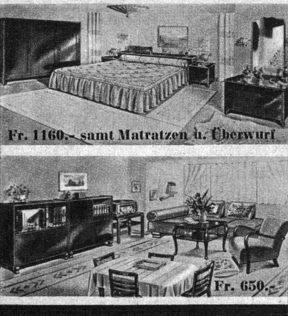
Fr. 1160.- samt Matratzen u. Überwurf

Spar-Angebot „Marguerite“ Unter- u. Obermatratzen, sowie Bettüberwurf im Preis inbegriffen. Beide Zimmer zusammen Fr. 1780.-