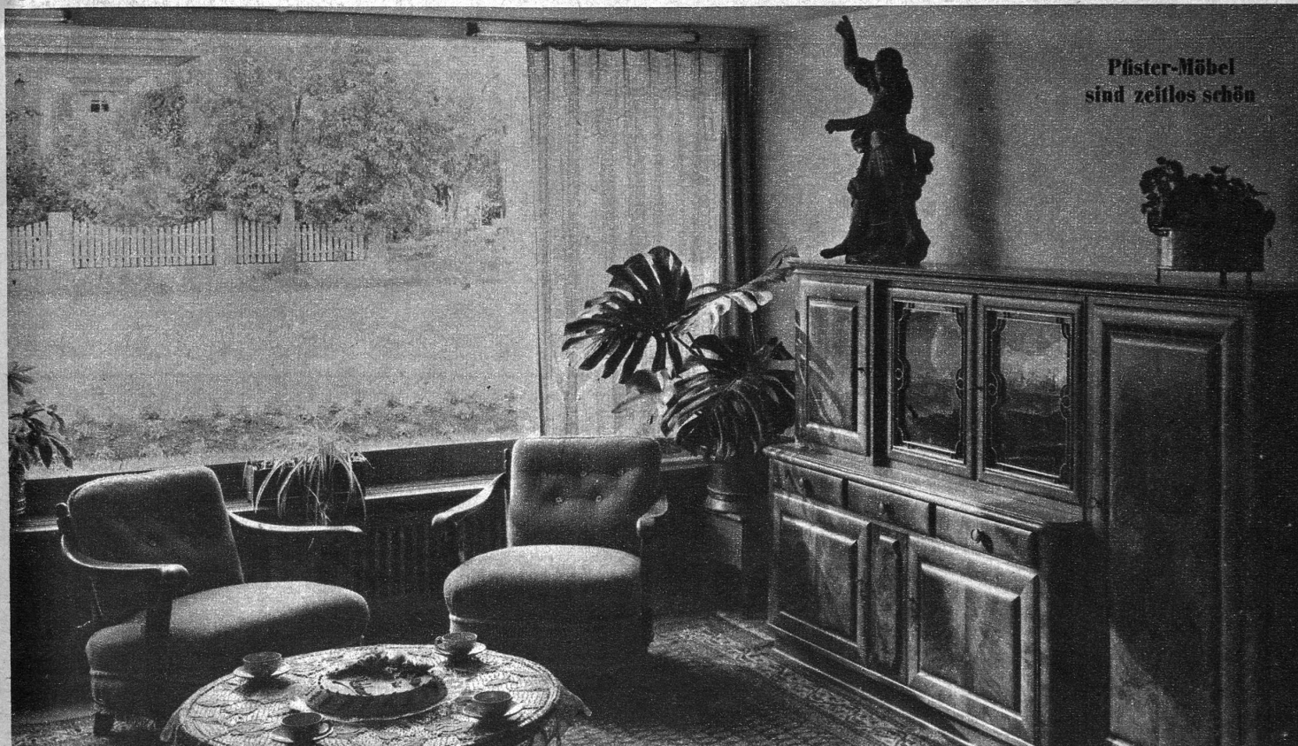
Pfister-Möbel sind zeitlos schön

Welch traumhaft schöne Stimmung spricht doch aus diesem vorbildlichen Intérieur! Räume voller Behaglichkeit und Atmosphäre sind die liebevoll gepflegte Spezialität der Möbel-Pfister AG. Kultivierte Intérieurs dieser Art kosten bei dieser Firma weniger als Sie glauben! Grosse Wohnkunst-Ausstellungen in Basel, Zürich, Bern, sowie in der Fabrik in Suhr bei Aarau. Reisevergütung bei Kauf einer Einrichtung. Franko-Hauslieferung überallhin. Den neuesten Katalog 1948 verlangen! Zustellung gratis. Dieses vornehme Intérieur ist jetzt in unsern Ausstellungen zu besichtigen! Möbel-Pfister AG, gegründet 1882.