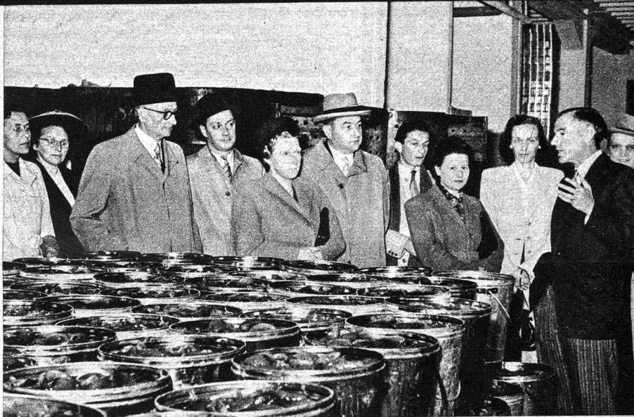
Teilführung der Gäste durch die Fabrik