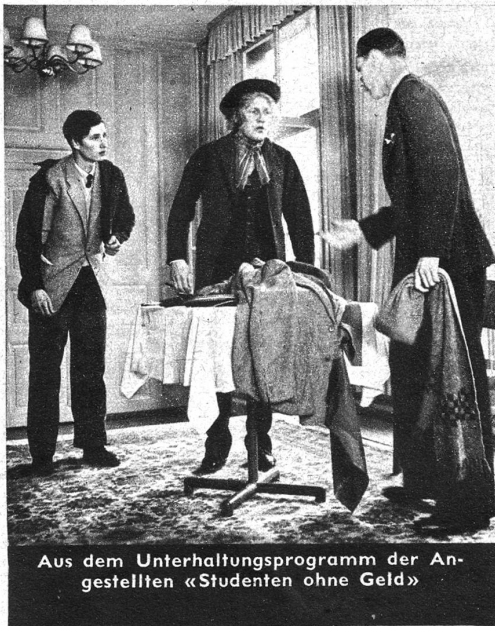
Aus dem Unterhaltungsprogramm der Angestellten «Studenten ohne Geld»

Eine stete Entwicklung des Geschäftes führt zu weiteren baulichen Vergrößerungen in den Jahren 1945 und 1946. Das Fabrikareal ist von 2104 qm im Jahre 1898 auf 10764 qm im Jahre 1948 angewachsen. Einer dringenden Notwendigkeit Folge gebend und hauptsächlich, um die Kundschaft auch während der grossen Einmachzeit im Sommer möglichst reibungslos und prompt bedienen zu können, beschloss der Verwaltungsrat am 23. Juli 1947, die Fabrik neuerdings zu vergrössern. Es werden 2126 qm Raum geschaffen und die bisherige Fabrikationsanlage nahezu verdoppelt. Mit dem Fabrikneubau wurde am 15. September 1947 begonnen, und die Fertigstellung wird im Jubiläumsjahr 1948 ihrer Vollendung entgegengehen. Daneben wurden in Marin bei St-Blaise, am Neuenburgersee,