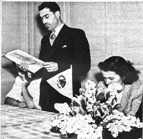
Vorlesung der Jubiläumsschrift