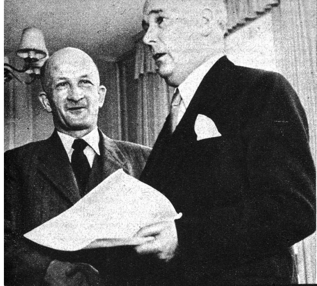
Ehrung eines verdienten Mitarbeiters