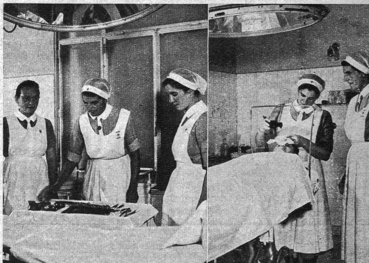
Im Operationszimmer. Das ganze Instrumentarium muss man kennen lernen