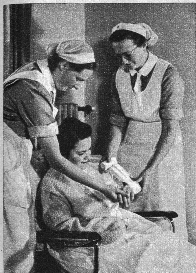
Praktischer Unterricht. Hier wird das Anlegen eines Verbandes geübt

Die berufliche Ausbildung einer Krankenpflegerin in einer vom Schweizerischen Roten Kreuz anerkannten Pflegerinnenschule dauert drei Jahre und umfasst mindestens 500 theoretische und praktische Unterrichtsstunden. Nicht alle Schulen halten sich an die gleiche Unterrichtsart. Bei den einen verbringen die Schülerinnen nur das erste Ausbildungsjahr in der Schule und im Schulspital; im