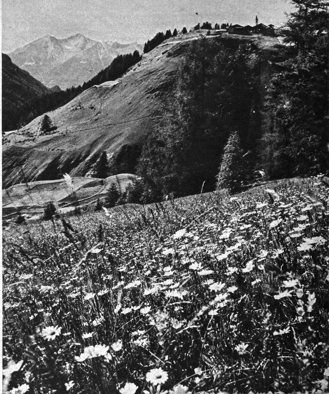
Sommertag im Albulatal. Rechts oben das Dörfchen Latsch

Dann schwieg mit einem Male alles Lärmen, und wie eine grosse Welle zuckte es durch die Schar der Alpmattner. Das Bergvolk sank in die Knie; die Bärenmützen der Gardisten kreisten zu Boden, Silberhaar alter Männer leuchtete auf, und weiss umschleierte Frauenhäupter neigten sich tief.