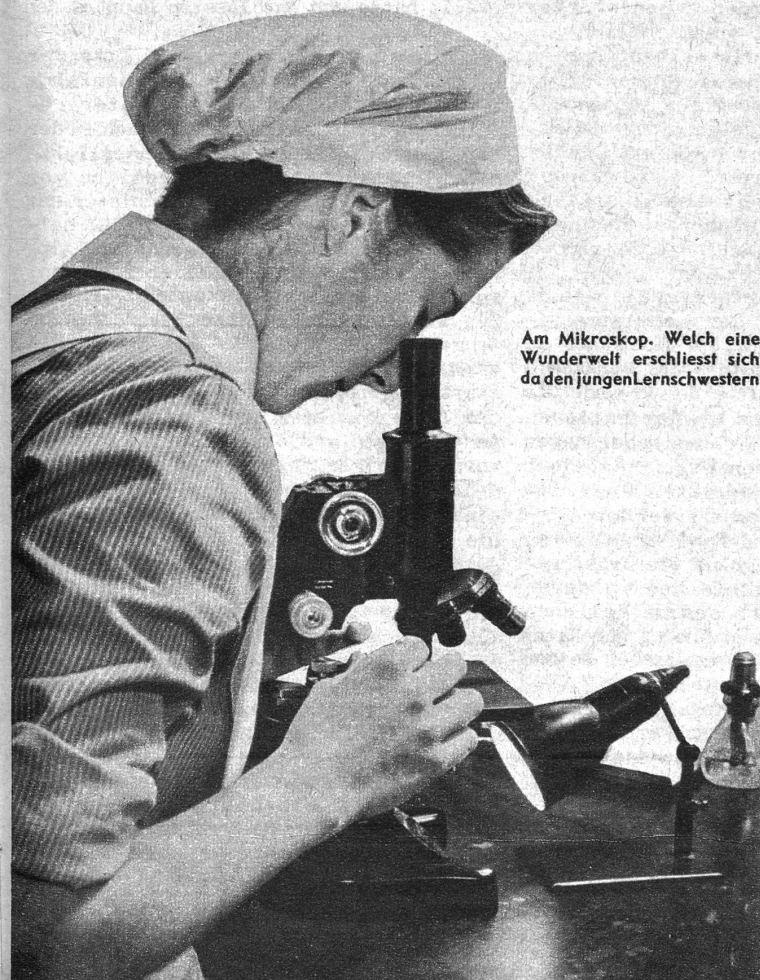
Am Mikroskop. Welch eine Wunderwelt erschliesst sich da den jungen Lernschwestern