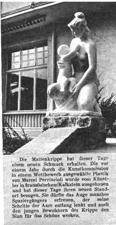
Die Mattenkrippe hat dieser Tage einen neuen Schmuck erhalten. Die vor einem Jahr durch die Kunstkommission in einem Wettbewerb ausgewählte Plastik von Marcel Perrincioli wurde vom Künstler in französischem Kalkstein ausgehauen und hat dieser Tage ihren neuen Standort bezogen. Sie dürfte das Auge manches Spaziergängers erfreuen, der seine Schritte der Aare entlang lenkt und auch den jungen Bewohnern der Krippe den Sinn für das Schöne wecken.

herbe Schneewinkelhorn gleich weichen, lindern Frauenarmen, die sich um einen eingepanzerten Krieger schlingen. Sie drangen aus der Tiefe der Staffalp in die weltferne Höhe und klangen so feierlich, weil sie heute zum ersten Male sargen und jubelten. Dem gestern abend war in die Hütte der Alp neues Leben eingezogen; mit etwa zwanzig Stück Vieh, mit seinem Sohn, dessen Weib und Kind, war der strubmähige, alte Senn, den im vergangenen Jahr Lauener in der oberen Hütte getroffen hatte, auf die Staffalp gekommen.