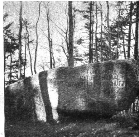
Der Findling am Hondrich ist mitten im Wald gelegen

Nicht weniger als vier Findlinge aus der Gletscherzeit sind im Gemeindebann von Spiez erhalten geblieben. Nördlich der Bürg liegt ein Granit, der vielleicht von der Höhe herabgestürzt ist und bisher wenig Beachtung fand. Am bekanntesten ist der Katzenstein in den Reben am Spiezberg, in ca. 600 Meter Höhe gelegen. Der grösste Gespene, der Fuchsenstein, findet sich in der Nähe der Eisenbahnbrücke über die Kander. Er hat eine Länge von fast 10 Metern und ragt 8 Meter aus dem Aluviaboden. Wie weit er in die Tiefe reicht, ist bisher noch nicht untersucht worden. den höchsten Standort hat der erratische Block auf dem Hondrichhügel, der in einer Höhe von 850 Metern frei auf den Felsen aufliegt. Glücklicherweise sind alle vier Spiezsteine geschützt.