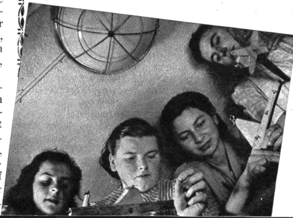
Links: Das Spielen mit den Fingern fordert gespannte Aufmerksamkeit und grosse Geschicklichkeit. Keinen Augenblick darf man seine Finger ausser Acht lassen oder den Arm sinken lassen. Der Raum auf der Bühne ist eng, und es heisst ständig aufpassen, dass sich nicht die Fäden zweier Figuren verwickeln.

«Und kniee nieder und danke Gott auf den Knien, mein Schwiegersonn», fuhr der Färber fort, «dass kein Wind gegangen ist. Hundert Jahre werden wieder vergehen