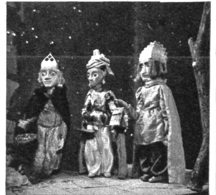
«Wir sind die heiligen drei weisen Mann, Wollen gern das Kindlein beten an.»