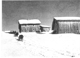
Unterwegs von Safien-Thalkirch nach Safien-Platz