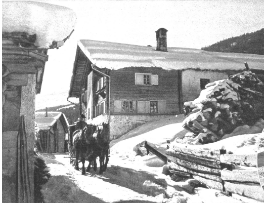
Mit dem altväterlichen Fiedereschlitten kann man von Versam bis nach Safiental zirka 6 Stunden fahren, allerdings ist es nicht für jedermann

hob sie die Lampe aus dem eisernen Gehäuse und schritt zur Tür. "Kommt doch! Hier plaudert man nicht abends, wenn der Morgen voll Arbeit ist." Sie beleuchtete ihm seinen Weg über die Treppe, bis er vor der Tür seines Zimmers stand. "Schlaf wohl!" Unten klopfte eine Tür, und der Lichtschein wurde Jährlings abgeschnitten. Noch klopfen Schritte, dann war es still. Nur der Bach raunte nachdenklich durch die Nacht in erdigen Monologe über seiner Wellen Urst. Launer tastete nach der Klinke und fand auch sein Zimmer dunkel. Er brante eine klobige Unschlittkerze an, die neben seiner Bette stand, und sah, dass