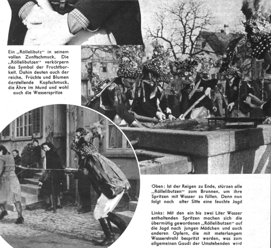
Oben: Ist der Reigen zu Ende, stürzen alle „Röllelibutzen“ zum Brunnen, um ihre Spritzen mit Wasser zu füllen. Denn nun folgt nach aller Sitte eine feuchte Jagd.

Anschließend dem Umzug produzieren die Röllelibutzen einen künstlerisch gestalteten Reigen komplizierter Figuren. Dicht gedrängt stehen die Zuschauer um den reigen Platz, um von allen schönen Brauch je nichts zu verkümmern.