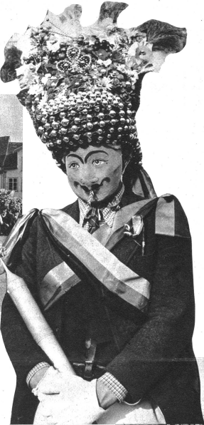
Ein „Röllelibutz“ in seinem vollen Zunftschmuck. Die „Röllelibutzen“ verkörpern das Symbol der Fruchtbarkeit. Dabin deuten auch der reiche, Früchte und Blumen darstellende Kopfschmuck, die Ähre im Mund und wohl auch die Wasserspritze.