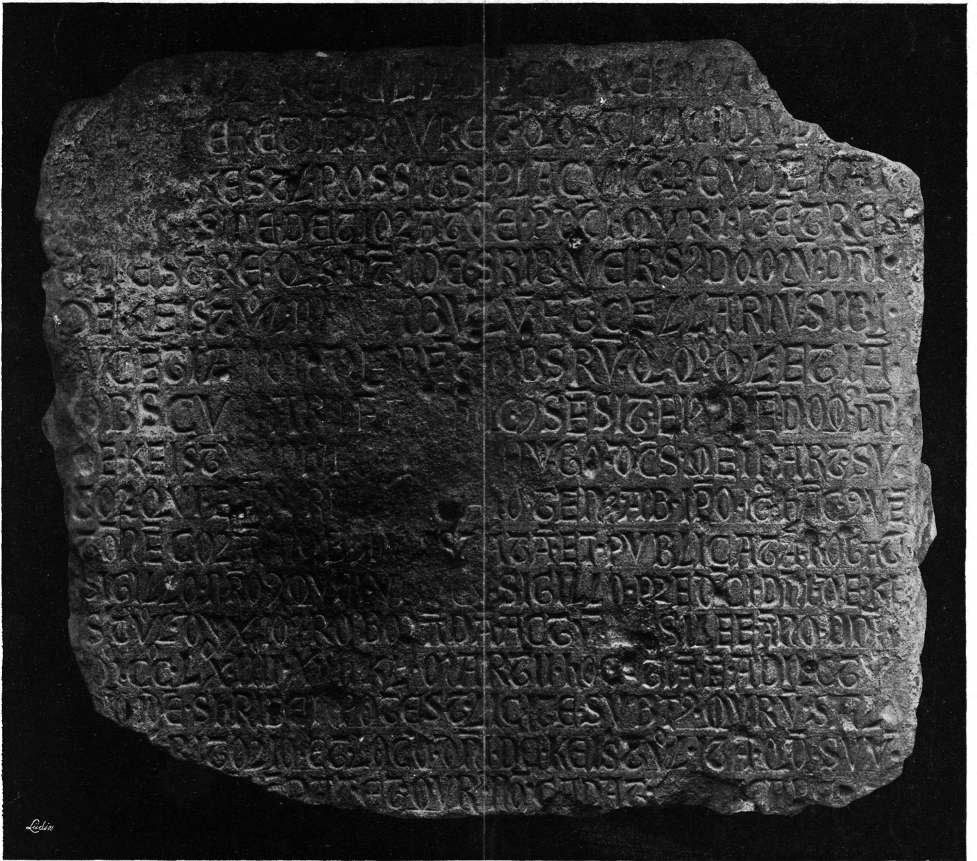
TAFEL V. Basler Steinkunde von 1264.