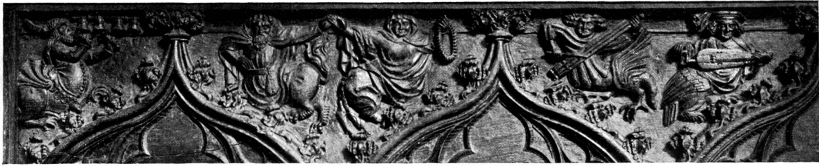
A. Stephanscapelle, links.