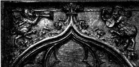
B. Galluscapelle, Mitte.