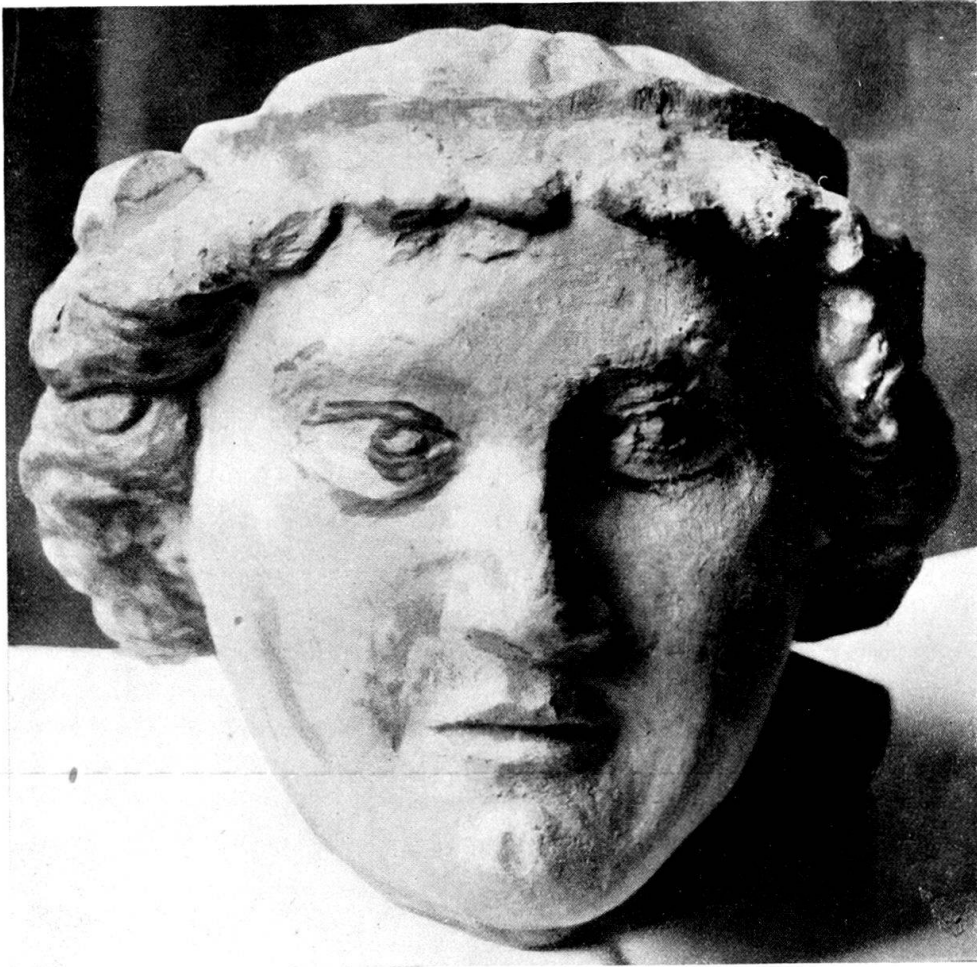
Tochter des Stifterpaares. Ostseite des dritten Schlußsteines.