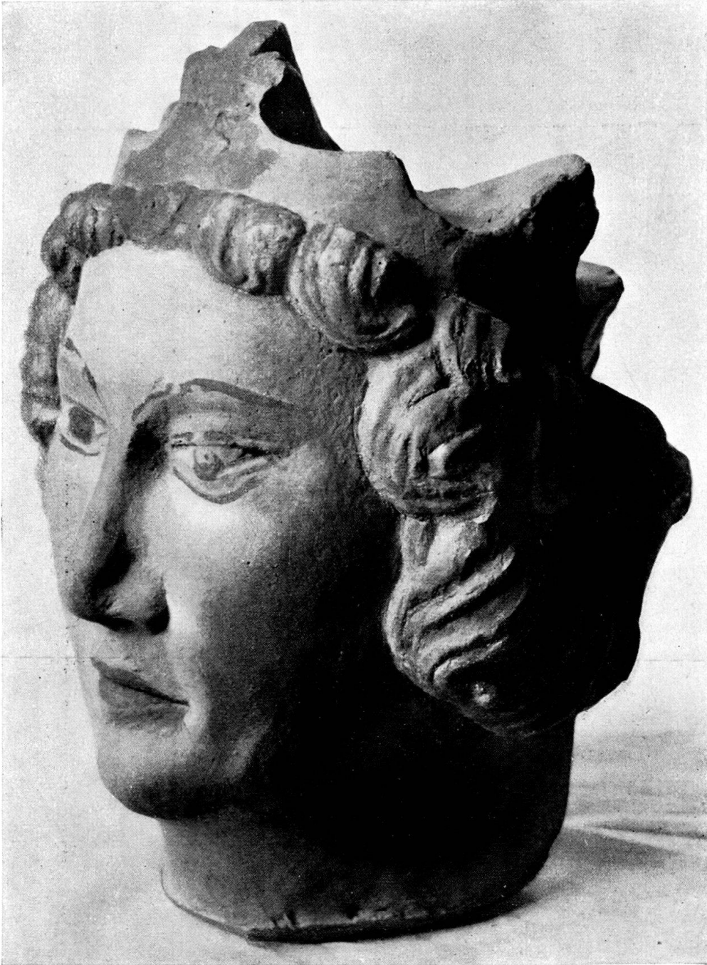
Fürst. Westseite des sechsten Schlußsteines