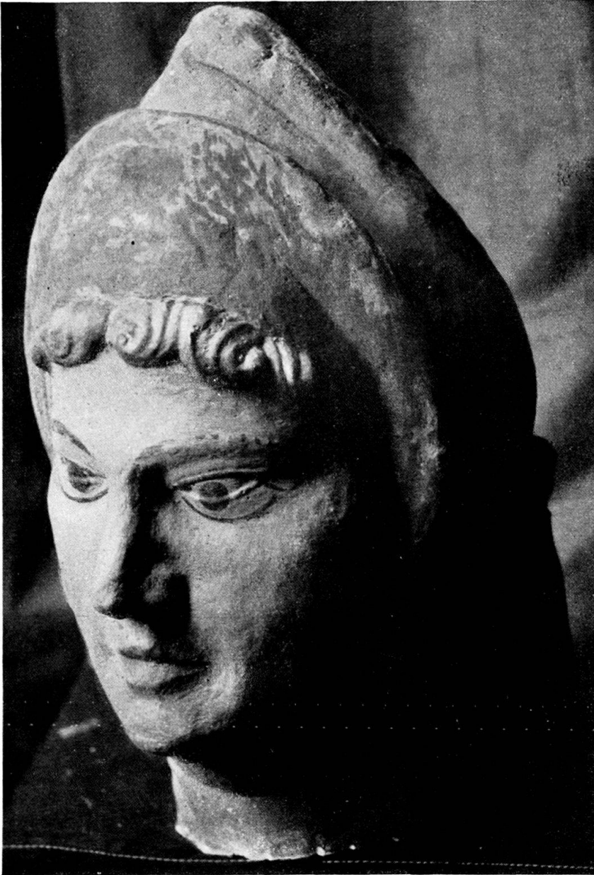
Die Priorin des Klingenthals. Ostseite des sechsten Schlußsteines.