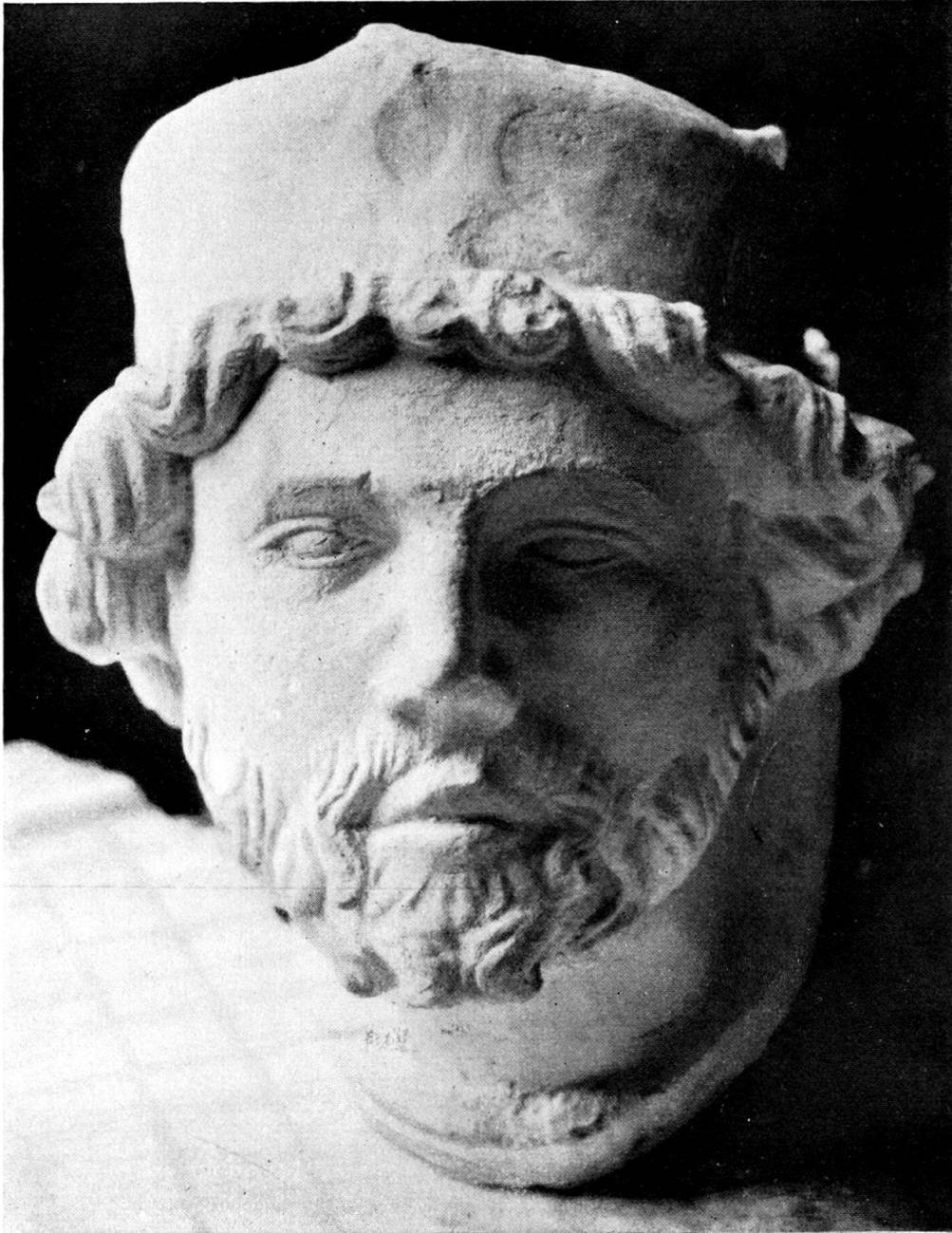
Walter (III) von Klingen, Stifter. Westseite des dritten Schlußsteines.