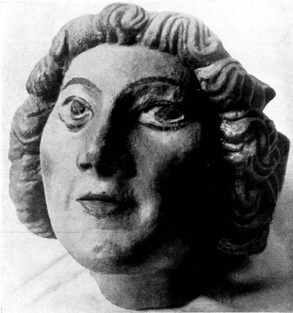
Tochter des Stifterpaares. Ostseite des vierten Schlußsteines.