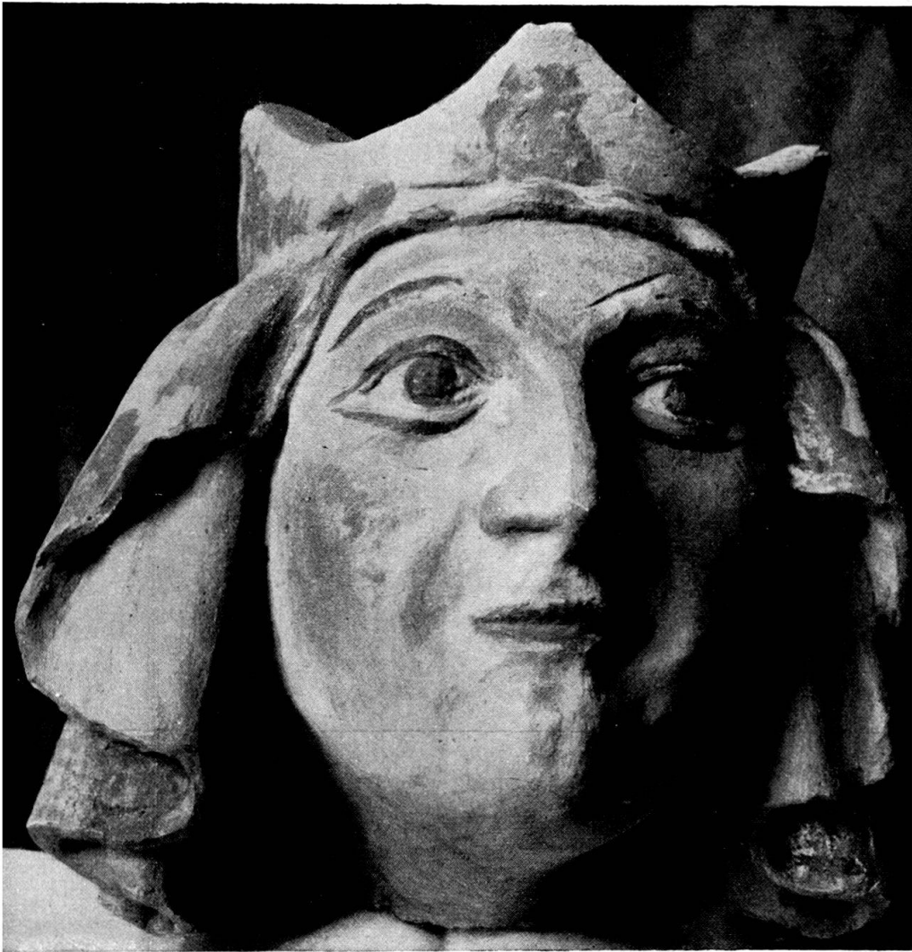
Tochter des Stifterpaares. Westseite des vierten Schlußsteines.