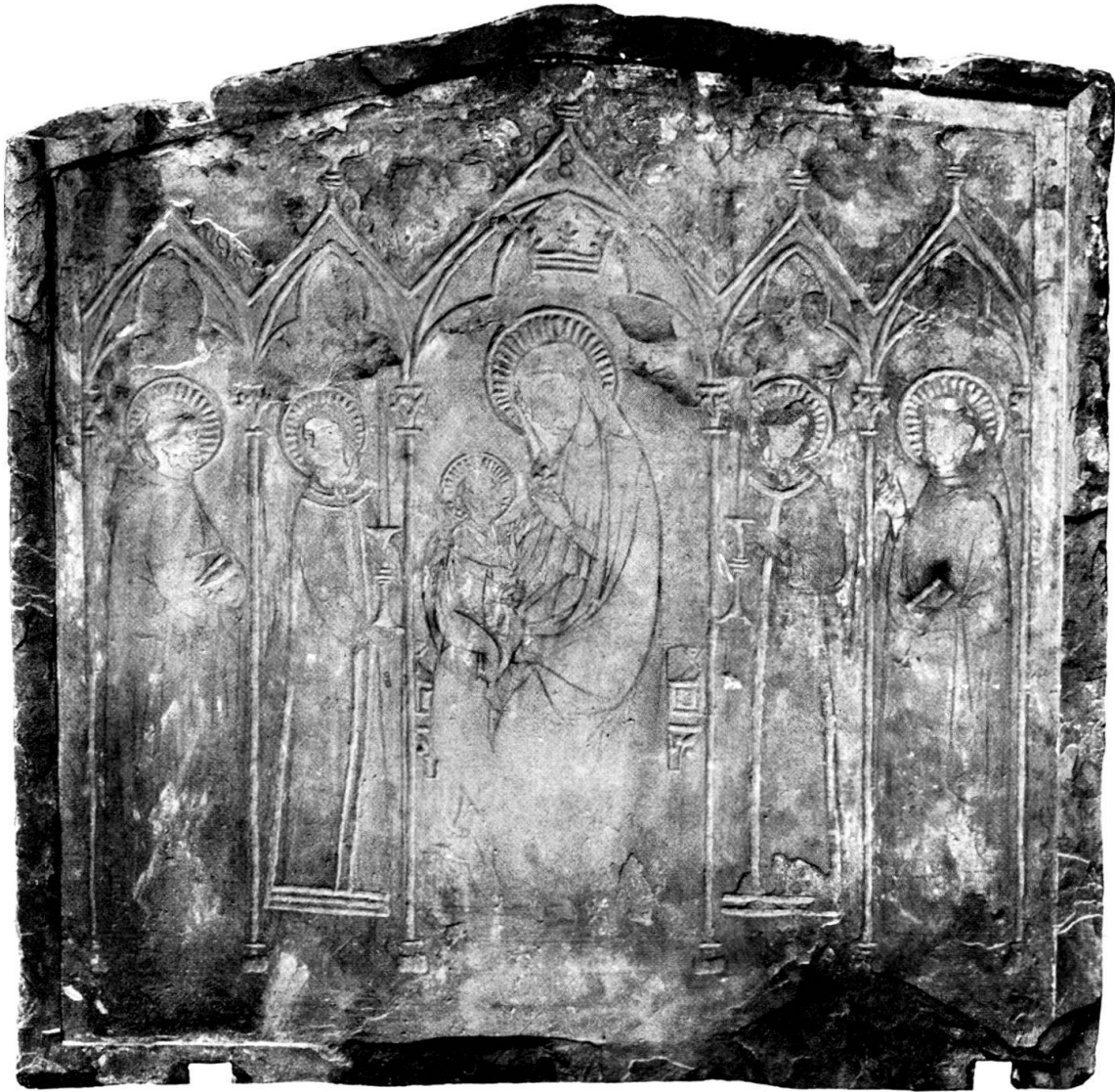
Altarbild aus der Predigerkirche, Ende des 14. Jahrhunderts.

Aus dem Jahrbuch der preußischen Kunstsammlungen XXVII (1906) S. 184.