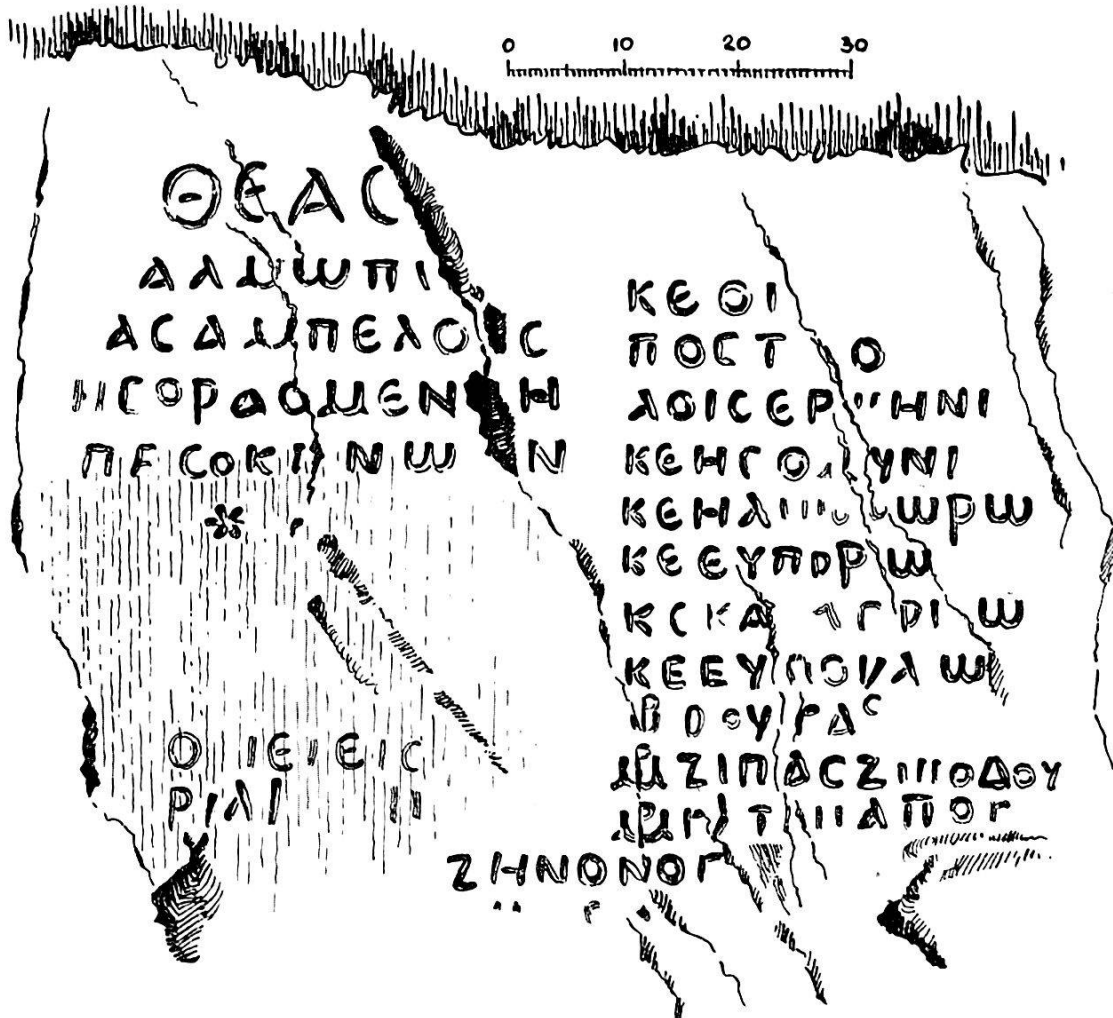
Fig. 1. — Inscription du Pangée.

12 et 15, moins lisibles. L. 17: nous restituons, au début, le même sigle qu'au début des deux lignes suivantes, sigle qui traduit, pensons-nous, le chiffre ρμ' (= 140); nous interprétons ensuite ὁ [ᾷ]ύ[σ]ας, mais il n'est pas exclu qu'il faille restituer là, plutôt, un nom de personne. L. 19: les premières