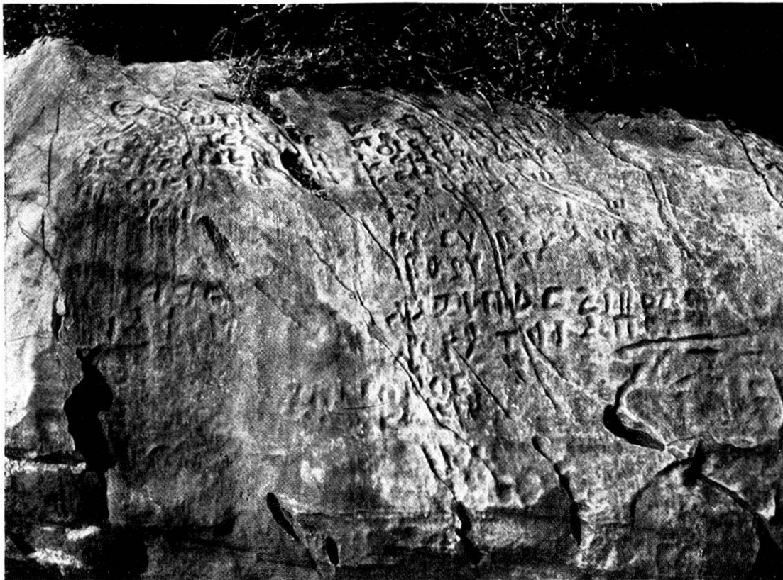
Inscription du Pangée.