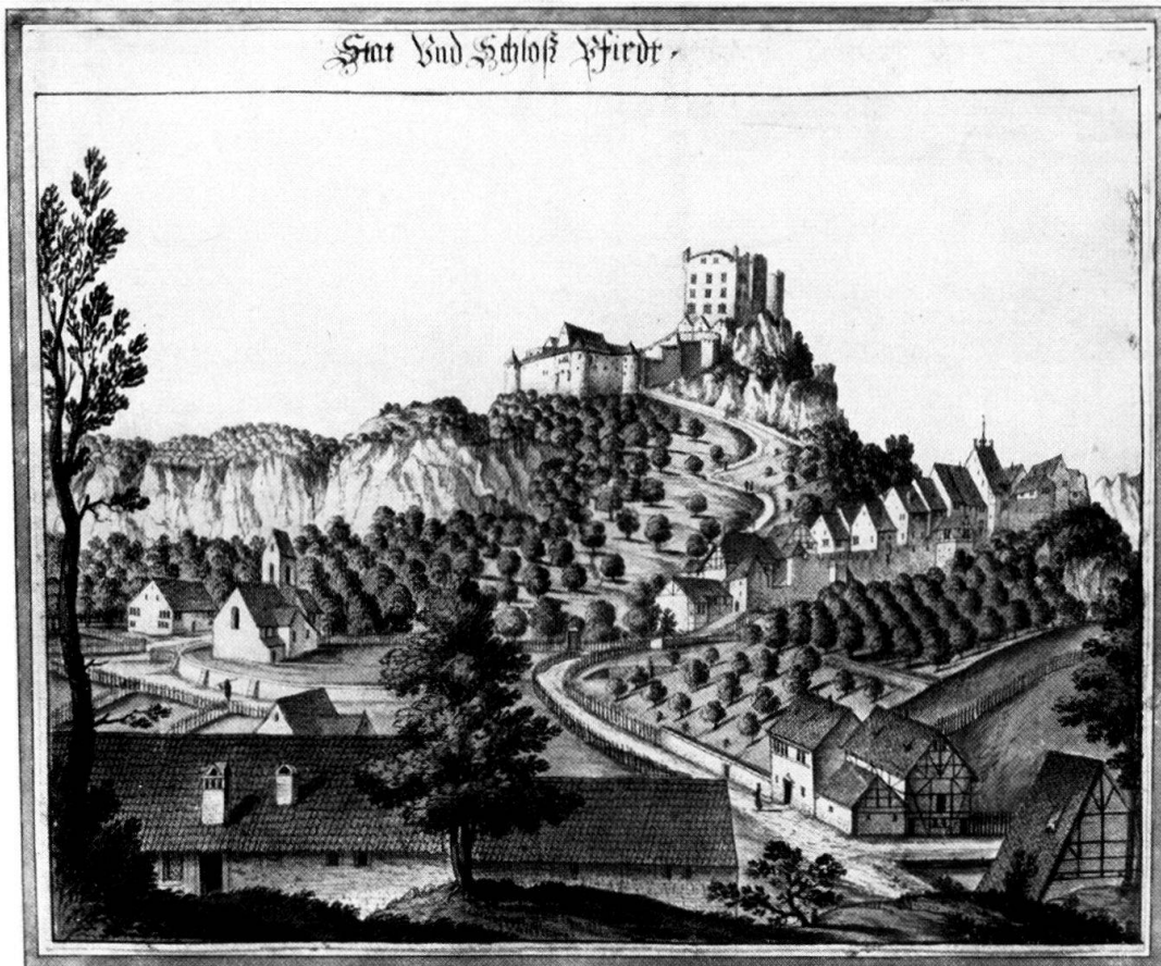
Tafel 2: Albrecht Kauw, Stadt und Schloß Pfirt.

Aquarell aus der Zeit um 1670. Sammlung Kauw, Historisches Museum Bern.