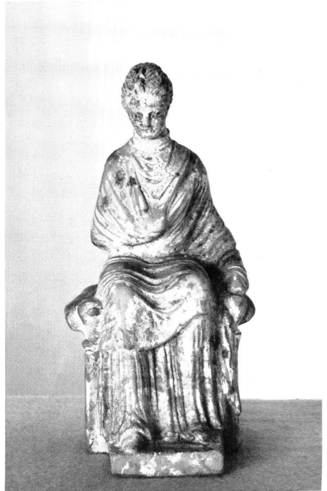
Taf. 34 b. Tonstatuette eines sitzenden Mädchens. H. 13 cm.