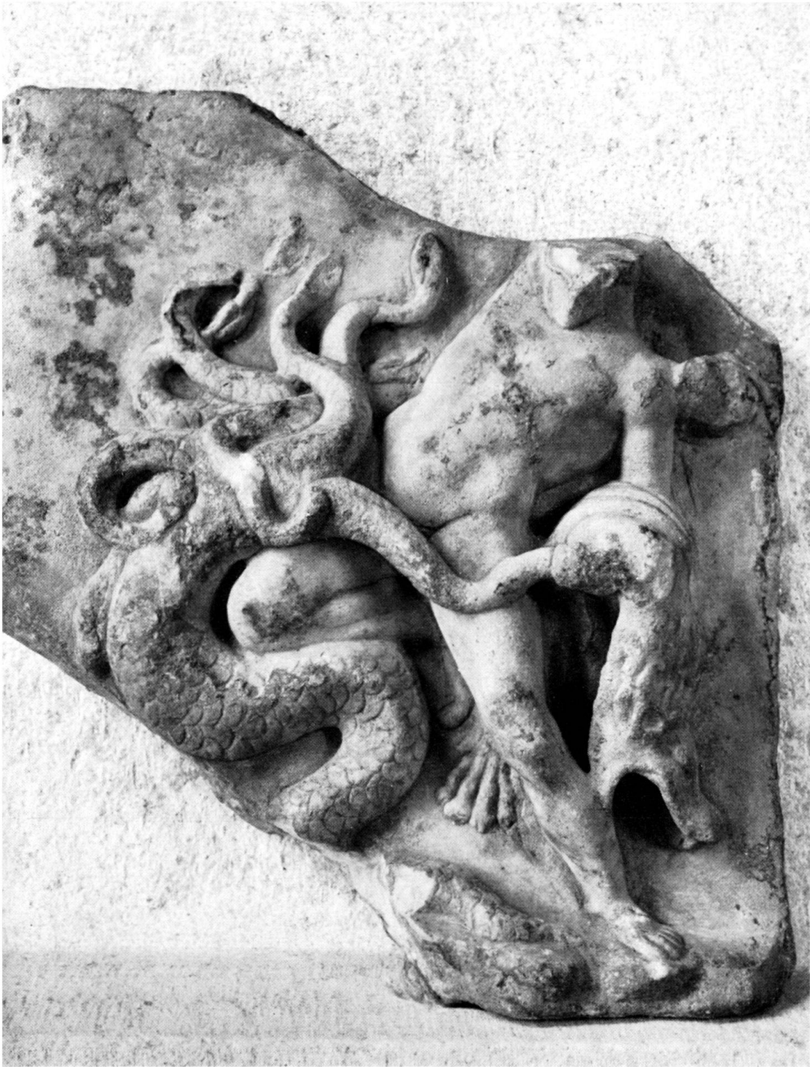
Taf. 37. Relief des Herakles im Hydrakampf. H. 27,7 cm.