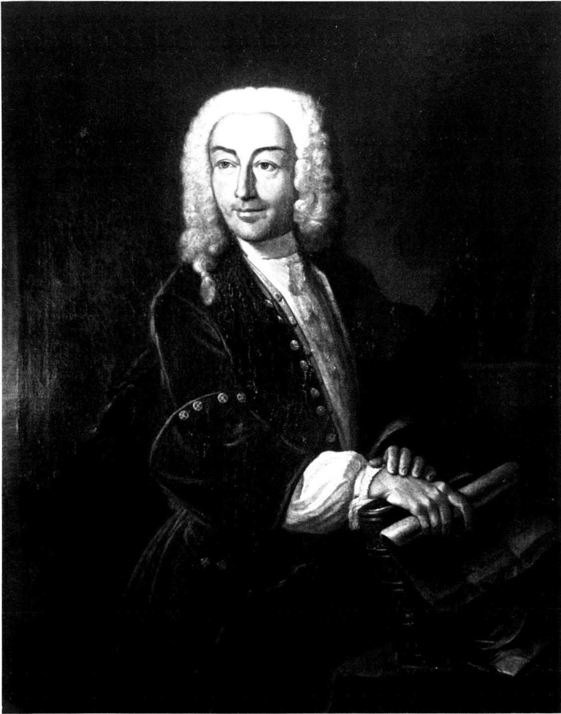
Carl Friedrich Drollinger

Oelporträt des Basler Kunstmalers Johann Rudolf Huber (1668–1748), heute als Depositum der Oeffentlichen Kunstsammlung im Basler Staatsarchiv, vgl. S. 158.