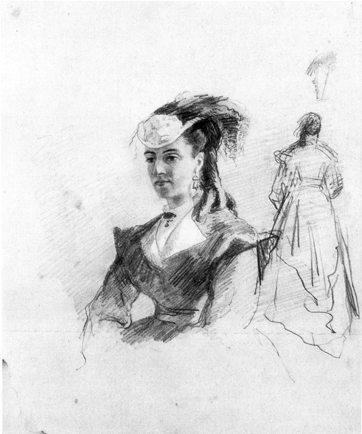
Gattin des W. H. Seward Bleistiftzeichnung, Kupferstichkabinett Basel