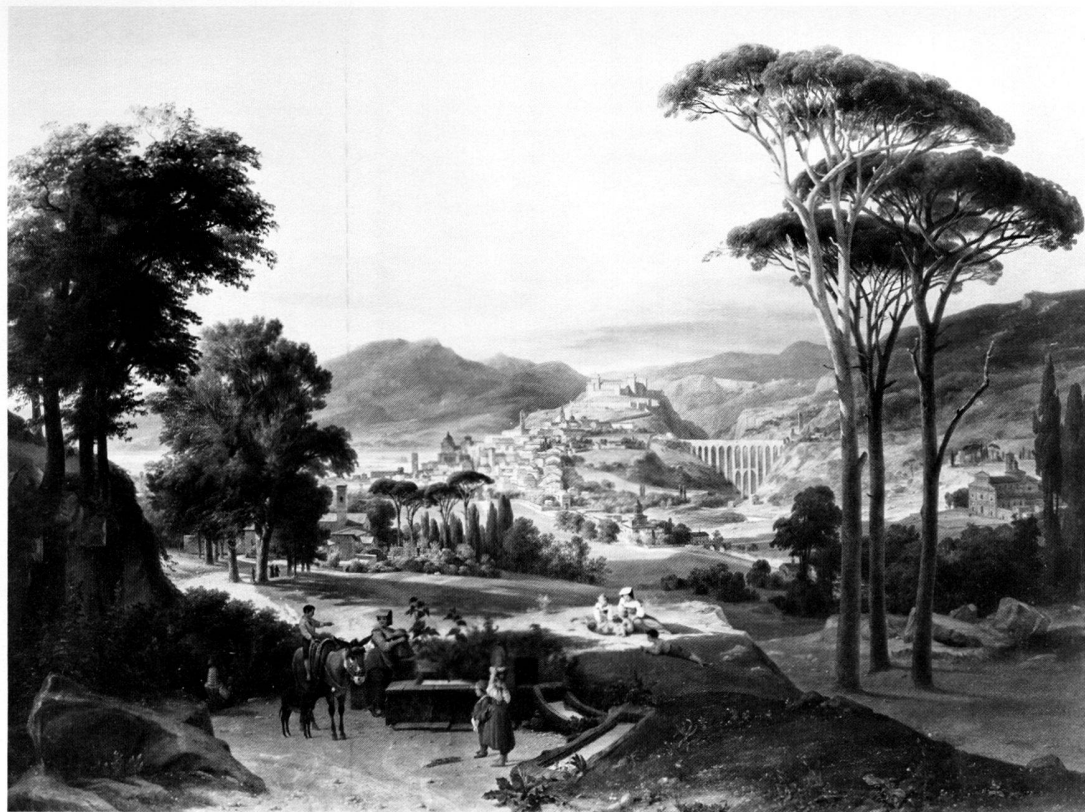
Tafel 2. Wilhelm Ablborn: Ansicht von Spoleto. (Hannover, Niedersächsische Landesgalerie).