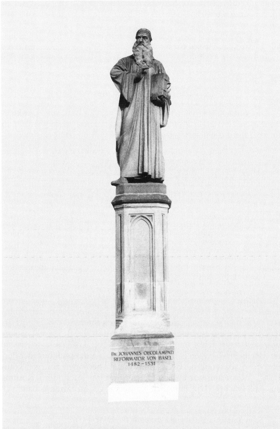
Ab. 2. Das Oecolampad-Denkmal in Basel, geschaffen 1862 vom Zürcher Bildhauer Ludwig Keiser.