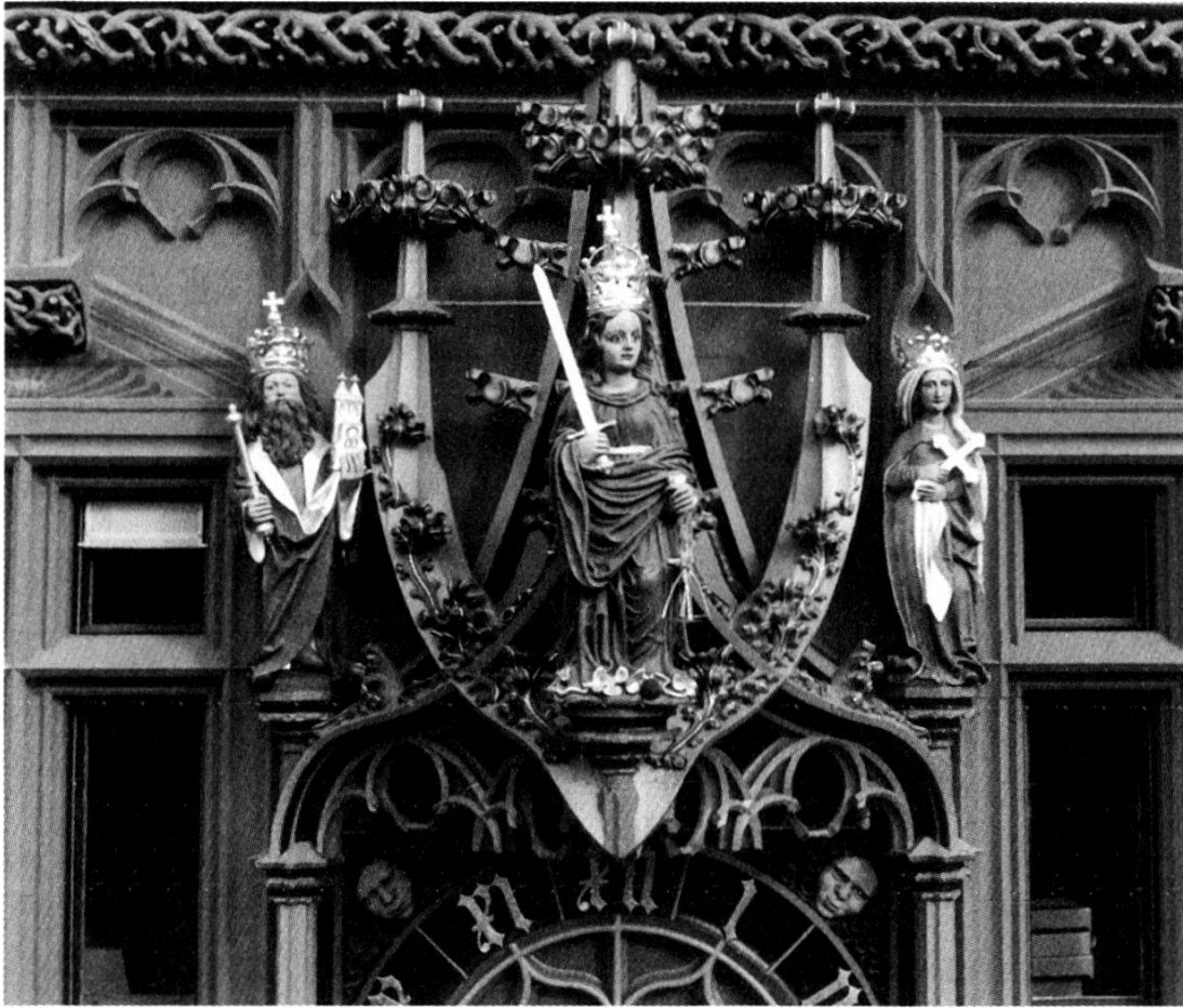
Abb. 3. Uhrgehäuse an der Marktfassade des Basler Rathauses mit Statuen der Madonna (Mitte; 1608 umgewandelt in eine Justitia) sowie des Kaiserpaars Heinrich und Kunigunde (seitlich), Originale von Hans Thur im Rathaushof unter den hinteren Arkaden, 1510/11

des kennzeichnendes Attribut, das Kreuz, auf eine Stiftung, welche stets mit dem Namen ihres Gatten in Verbindung gebracht wurde.