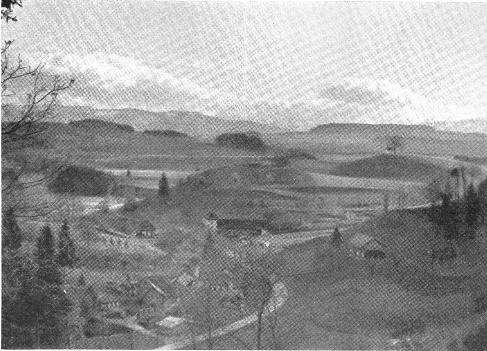
Nordseite der Anhöhe von Zirkels mit Burgplatz (Mitte) und Kapelle (rechts). Im Vordergrund Mühlethal.