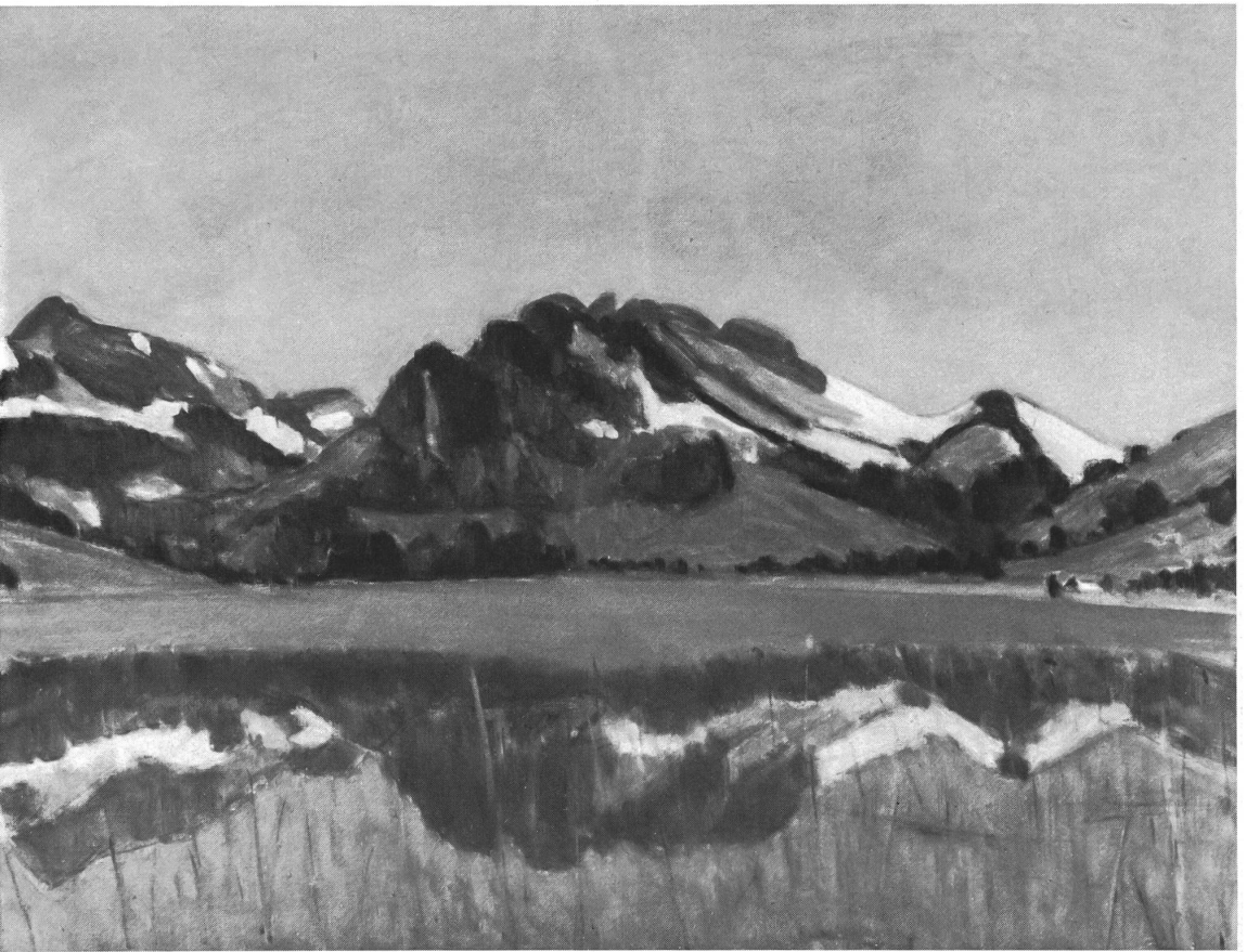
Aus der Ausstellung Nr. 4: Sensler Landschaften Hiram Brillhart, Schwarzsee, um 1935, 86 × 67 cm. Musée Gruyères, Bulle. (Foto J.-C. Abby, Museum für Kunst und Geschichte, Freiburg)