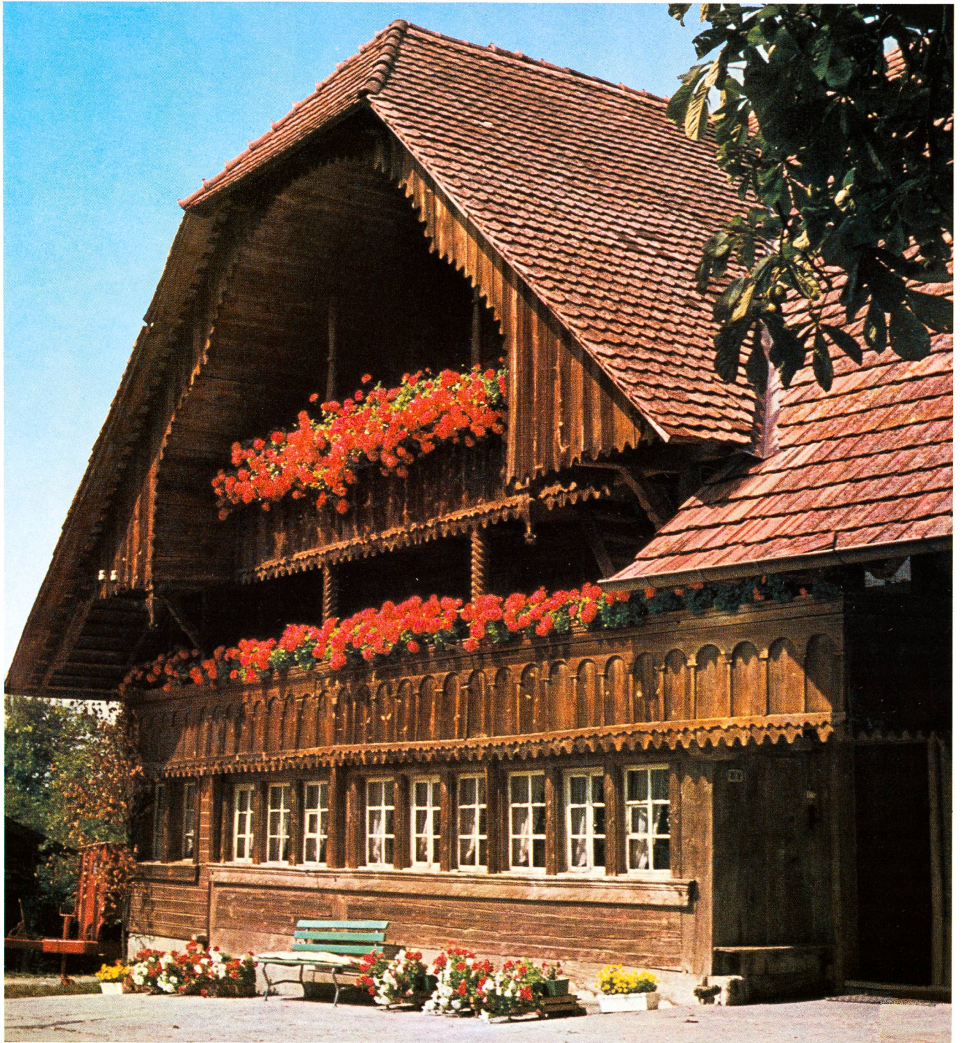
1 Brugera/Düdingen 81 (1834) Von Zimmermeister Urs Meuwly erbautes Quergiebelbogenhaus mit Doppellaube: Höhepunkt senslerischer Holzbaukunst! (vgl. S. 242)