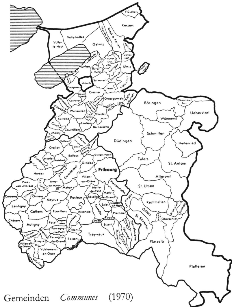
Gemeinden Communes (1970)