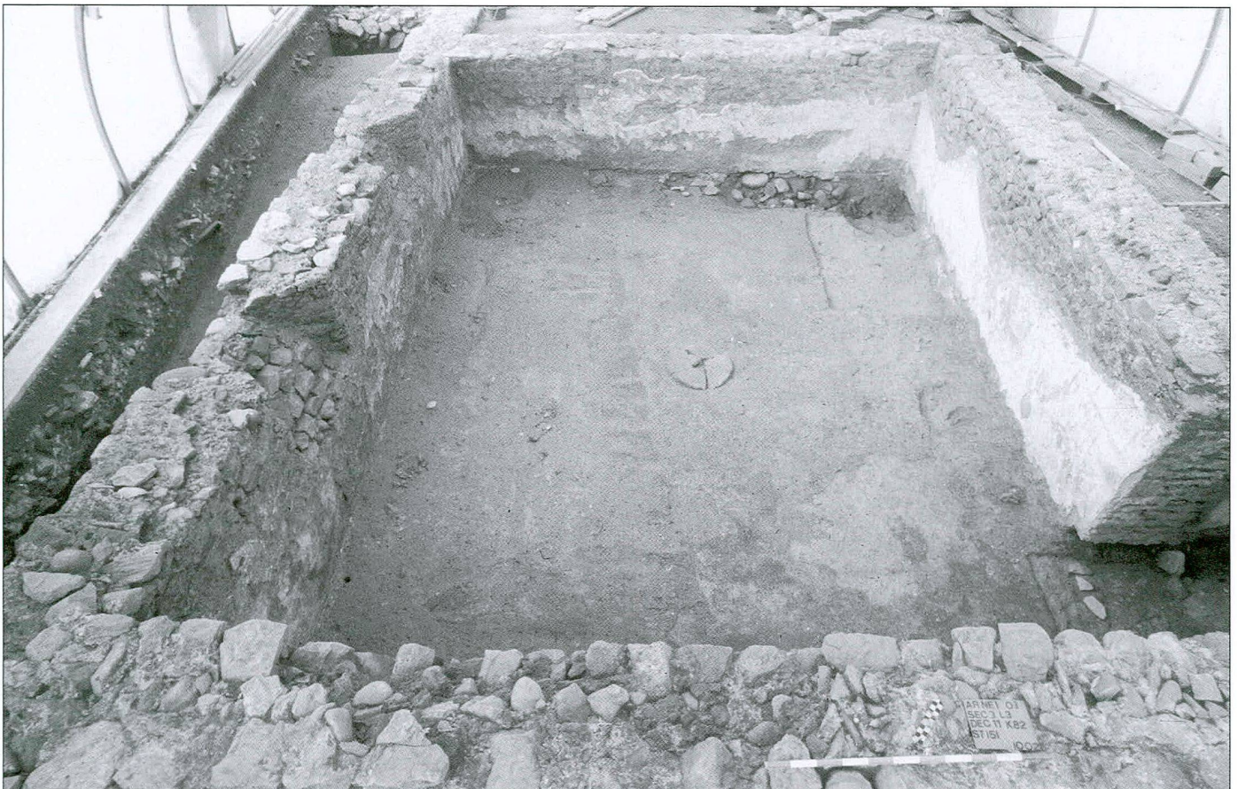
Fig. / Abb. 4 Vue générale de la salle souterraine depuis l'est Ansicht des Kellerraums von Osten

axial de 34 x 24 m et comporte une série de pièces alignées parmi lesquelles, en particulier, une grande salle souterraine qui ferme l'édifice au sud-ouest (fig. 3, A). L'ensemble est flanqué de deux portiques latéraux et est bordé symétriquement à l'ouest par deux volées d'escaliers extérieurs. Apparue au sud, en limite de fouille, une double annexe intégrant un hypocauste en constitue vraisemblablement l'extension thermique. Exceptionnellement bien conservée, la salle souterraine (7,80 x 5,80 m) montre des murs préservés sur une hauteur de 2,30 m (fig. 4), dont les parements sont enduits d'un crépi au tuileau blanchi à la chaux. Une cage d'escalier en bois, fermée à chaque extrémité par une porte, permettait d'y accéder uniquement depuis l'intérieur du bâtiment. Deux soupiraux percés dans la façade sud du bâtiment et ouvrant sur une grande cour assuraient l'éclairage et l'aération de la salle. Sous le sol de marche, constitué à l'origine d'un plancher de bois, courait le long des murs un profond drain entaillant la molasse, qui collectait les eaux d'infiltration et les évacuait hors du bâtiment. Le comblement de cette salle excavée intégrait des éléments participant à la décoration de l'étage supérieur, notamment des enduits peints du II e