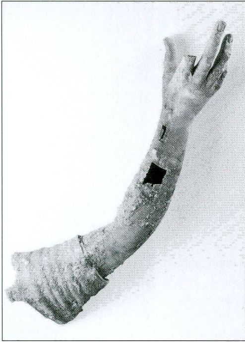
Fig. / Abb. 6

Bras droit en bronze détaché d'une statue plus grande que nature (avant restauration)