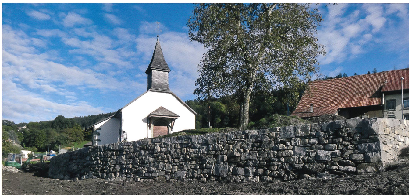
Fig. 1 La chapelle de Morlens, autrefois église paroissiale dédiée à saint Maurice et saint Médard, et le mur de pierres sèches reconstruit par la FAFE

Dans le cadre des travaux de réfection du mur de clôture contournant la petite chapelle de Morlens (commune de Vuarmarens), autorisés par le Service des biens culturels et réalisés par la Fondation Actions en Faveur de l'Environnement (FAFE) (fig. 1 et 2), des sondages ont été effectués en automne 2012 par le Service archéologique 1 . Ce fut pour les archéologues l'occasion de mener les premières recherches autour de l'une des plus anciennes églises paroissiales du canton de Fribourg, encore méconnue de nos jours. Située au sud-ouest du district de la Glâne, à environ deux kilomètres du village d'Ursy, elle a été érigée au fond d'une large vallée, non loin du ruisseau du Vuaz, le long de la route d'accès aux quelques maisons et fermes du village actuel de Morlens.