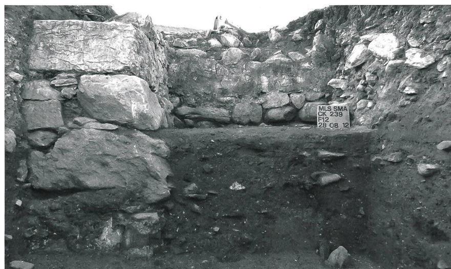
Fig. 4 Mur nord de la nef (parement nord) en arrière-plan et son contrefort au premier plan (sondage nord)

des avec Morlens sont nombreuses, notamment la situation topographique, le patronyme et la fonction (siège d'un décanat). D'importance nationale, le site de Belfaux est également connu pour sa vaste nécropole, qui a livré jusqu'à aujourd'hui près de 1300 tombes datant du Haut Moyen Age et du Moyen Age, et pour son habitat, situé à proximité et d'un grand intérêt scientifique: trous de poteau et fonds de cabane en font l'un des témoignages les plus importants d'un village médiéval suisse 9 .