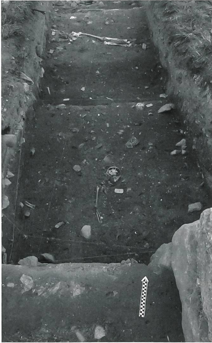
Fig. 5 Sépultures et contrefort (sondage nord)

La découverte de quelques sépultures autour de l'église de Morlens laisse aussi présager l'existence d'un vaste cimetière entourant l'édifice sacré. En revanche, aucune trace de structures d'habitat n'a encore été mise au jour et les sources écrites, pour la plupart des visites pastorales, ne mentionnent pas les maisons qui existaient probablement, mais peut-être en nombre assez modeste.