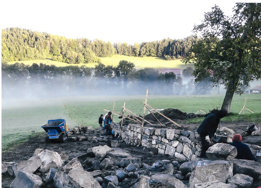
Fig. 2 Reconstruction du mur en pierres sèches

Deux tranchées ont été ouvertes autour de la chapelle, dans la zone nord-ouest de la parcelle, entre le sommet de la colline et le mur de clôture (voir fig. 3). La fouille du sondage nord a permis de mettre au jour un tronçon des fondations du mur nord de la nef ainsi que son contrefort, reportés sur le plan des géomètres et qui remontent manifestement à l'époque médiévale (fig. 4). Ces vestiges, les plus anciens repérés à ce jour, reposaient sur une couche de remblai contenant du mortier, signe évident de l'existence de constructions antérieures ainsi que de travaux de transformation d'un premier édifice sacré. En lien avec