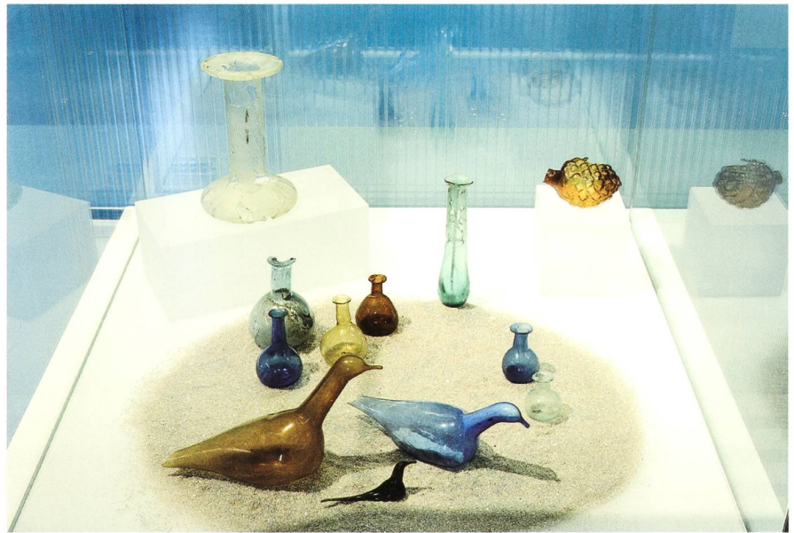
Fig. 1 Vases à parfum

Nous connaissons également les nombreux objets en lien avec les soins du corps, que les fouilles archéologiques livrent souvent: miroirs, peignes, épingles à cheveux, rasoirs, pinces à épiler, tablettes à fards, flacons à onguents et vases à parfums... Et encore: les cure-oreilles et les sondes auriculaires, les sondes-spatules et les sondes-cuillères aux noms savants de «spathomèles» et de «cyathis-comèles», autant d'instruments que se