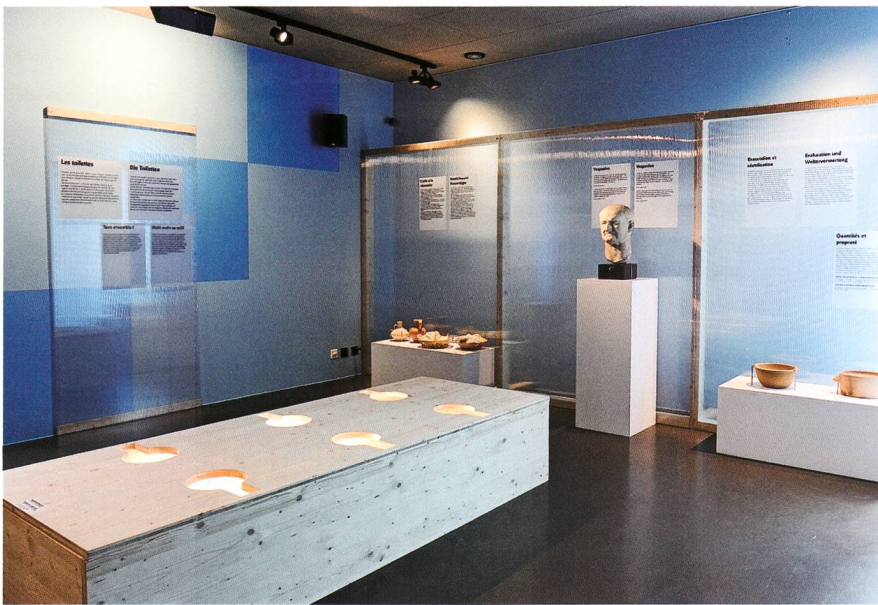
Fig. 3 «Seulement pour les intimes»: au premier plan, la reconstruction de latrines en bois

Plusieurs panneaux et quelques objets – parmi lesquels des pots de chambres et le portrait de l'empereur Vespasien, à qui on attribue volontiers mais à tort l'invention des vespasiennes – offrent un aperçu des usages en la matière, tout en évoquant la nécessité de bien organiser l'évacuation des urines et autres selles pour garantir la propreté d'une ville.