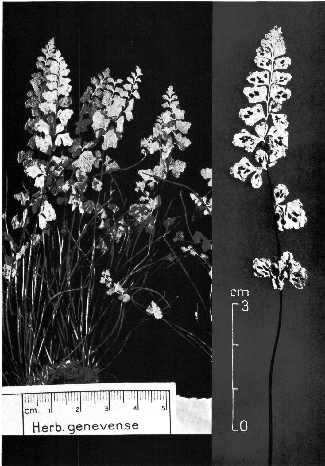
Fig. 1. – Asplenium x reuteri Milde (pro sp.), Typusexemplar (G): links Ausschnitt in Originalgrösse; rechts Einzelwedel, 1,5 x vergrössert, zeigt Sori sowie Braunfärbung der Rhachis (ca. 60%) und helle, ursprünglich grüne Spitze.