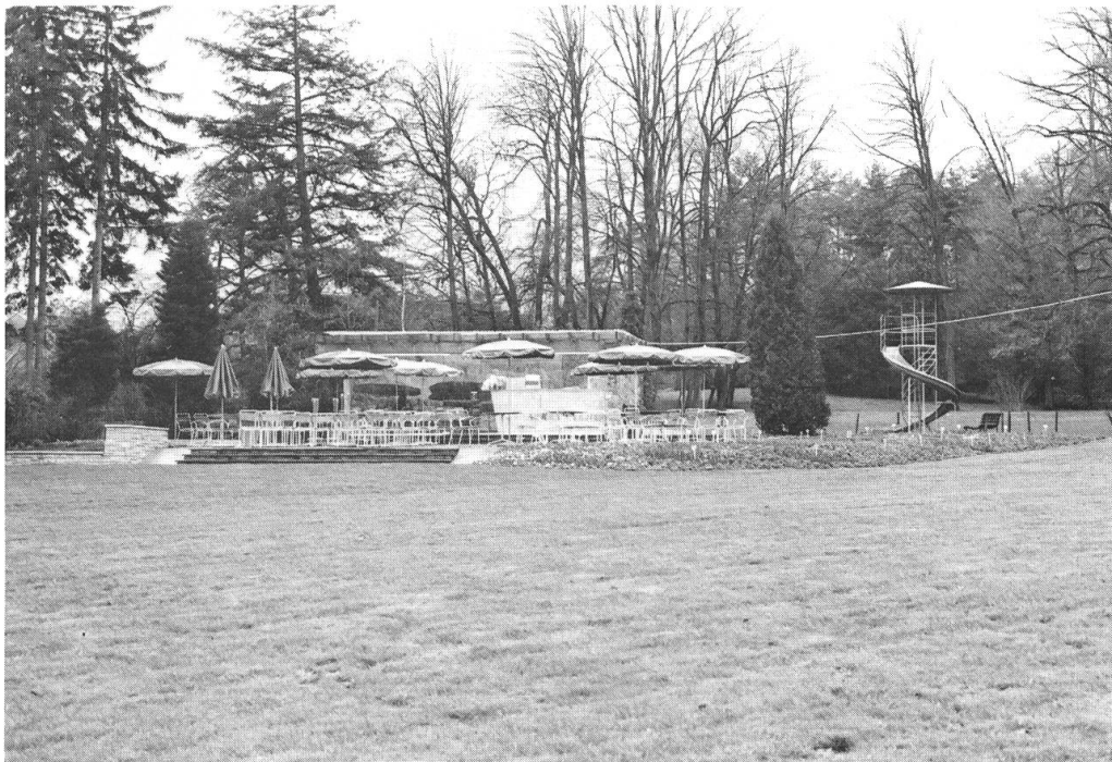
3. Une véranda appréciée des promeneurs et un toboggan qui enchante les petits.