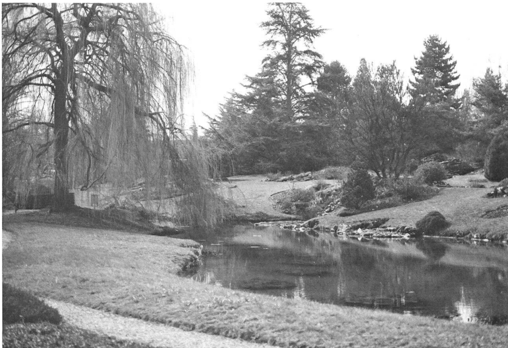
4. Un des multiples aspects du jardin.