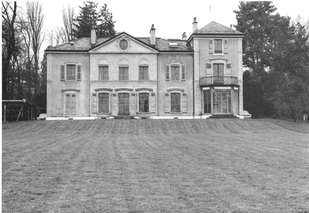
1. La Villa "Le Chêne" qui doit être restaurée en 1970.