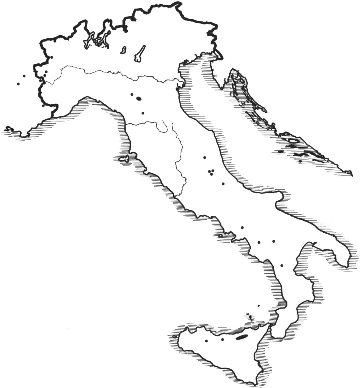
Karte 1. – Rumex nebroides Campd., Verbreitung auf der Apenninen-Halbinsel und in den West-Alpen.