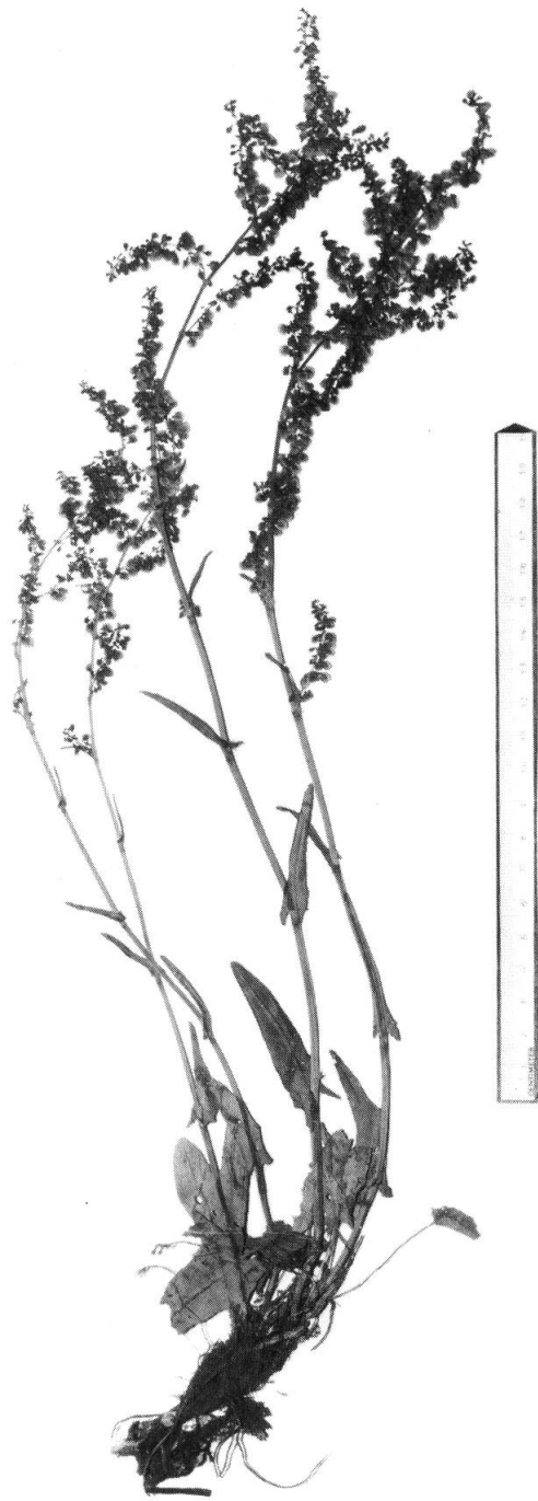
Rumex nebroides Campd., fruchtend (Rechinger & Sleumer 958, aus den Ost-Pyrenäen).