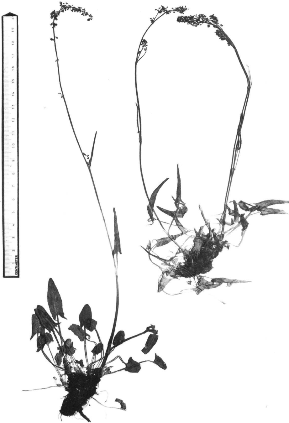
Rumex nebroides Campd., blühend: Links Rechinger 21580 , rechts Rechinger 21350 , beide aus Epirus.