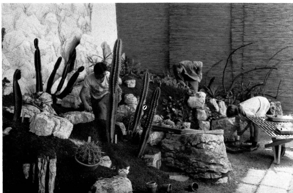
Exposition des Cactées à l'Orangerie (juin 1977).