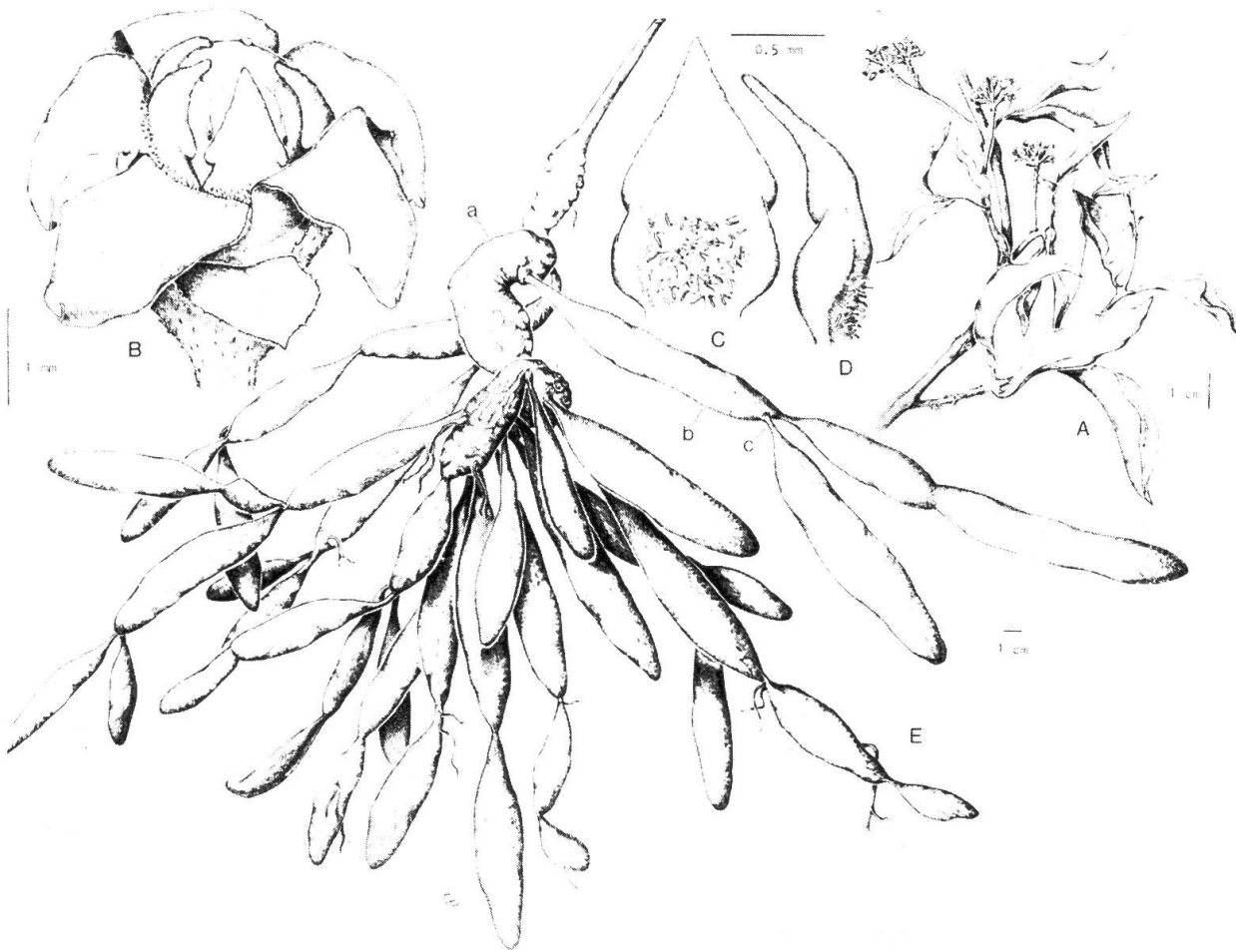
Fig. 3. — A, rama con inflorescencias; B, detalle de una flor; C, lóbulo de la corona, vista dorsal; D, lóbulo de la corona, vista lateral; E, aspecto de los órganos subterráneos de una planta: a, xilopodio; b, zona engrosada de la raíz; c, zona no engrosada de la raíz.

parenquimatosa del centro del órgano llega a ocupar hasta el 53% del diámetro de la transección del mismo. Células parenquimáticas medulares de 130(-230) \mu\text{m} de diámetro. Laticíferos y gránulos de almidón frecuentes.