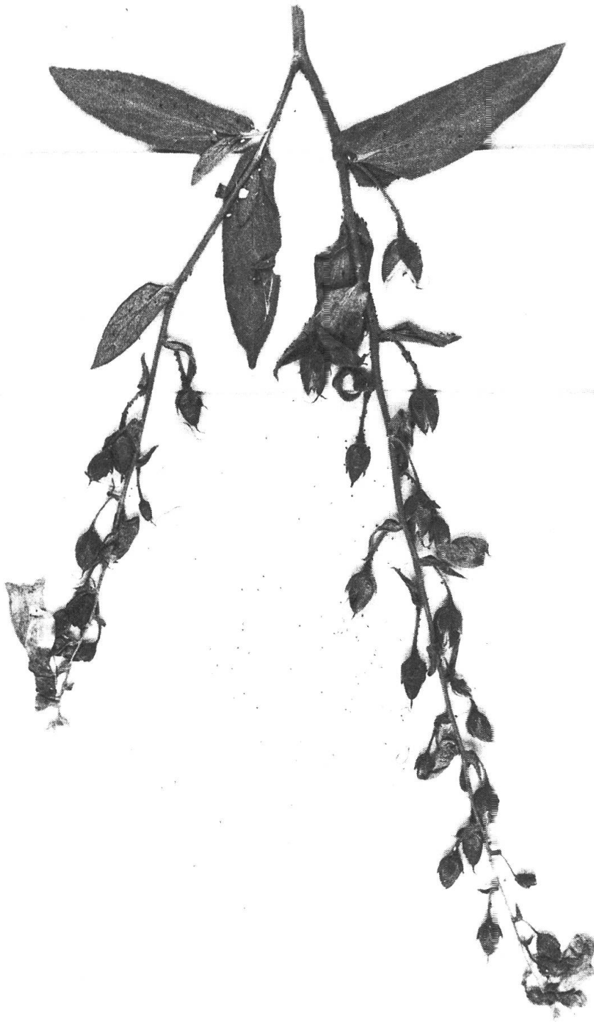
Fig. 2 (pages 188-189). — Néotype du Digitalis thapsi L.