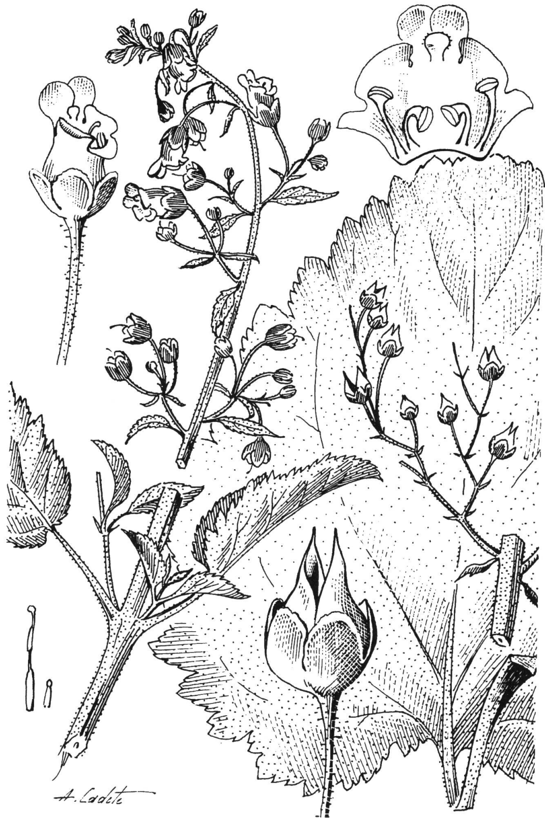
Fig. 2. — Scrophularia valdesii Ortega Olivencia & Devesa Alcaraz.