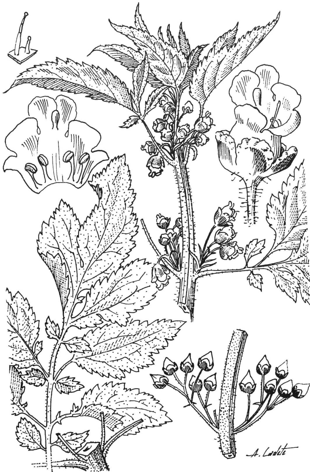
Fig. 1. — Scrophularia viciosoi Ortega Olivencia & Devesa Alcaraz.