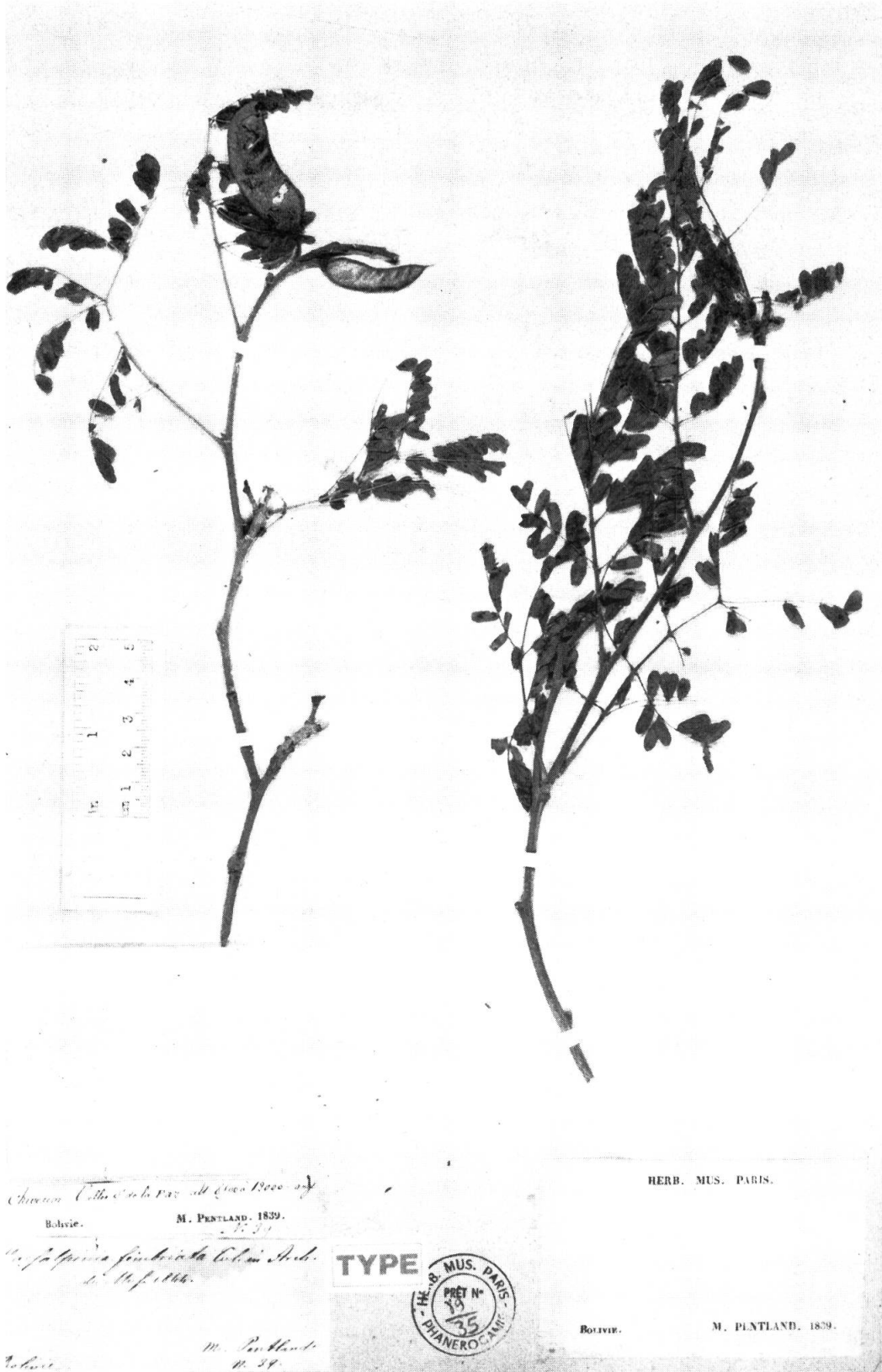
Fig. 1. — Caesalpinia fimbriata Tul.