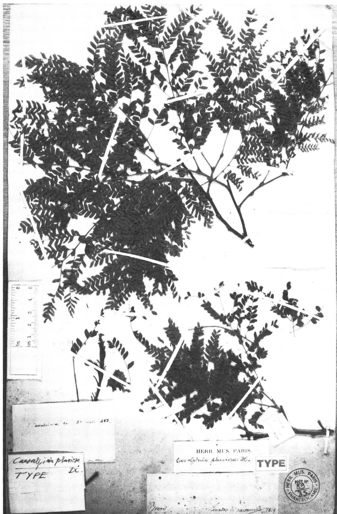
Fig. 2. — Caesalpinia pluviosa DC.