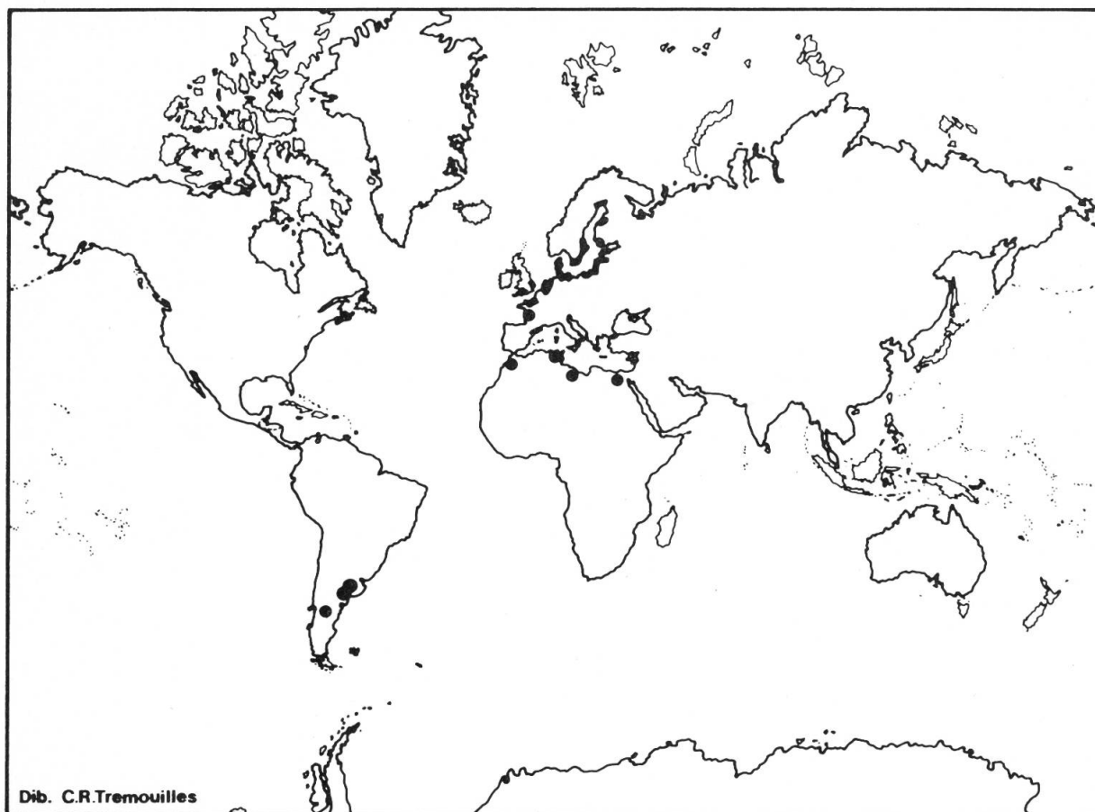
Fig. 1. — Distribución geográfica mundial de Chara baltica Bruzelius, incluyendo las localidades de Argentina.

MIGULA (1897), es habitante exclusiva de la costa y aparece en la costa misma o bien en aguas salobres en contacto directo con el mar (en relación al Mar Báltico), profundas o poco profundas, pero nunca en mares abiertos de salinidad normal ni en aguas dulces.