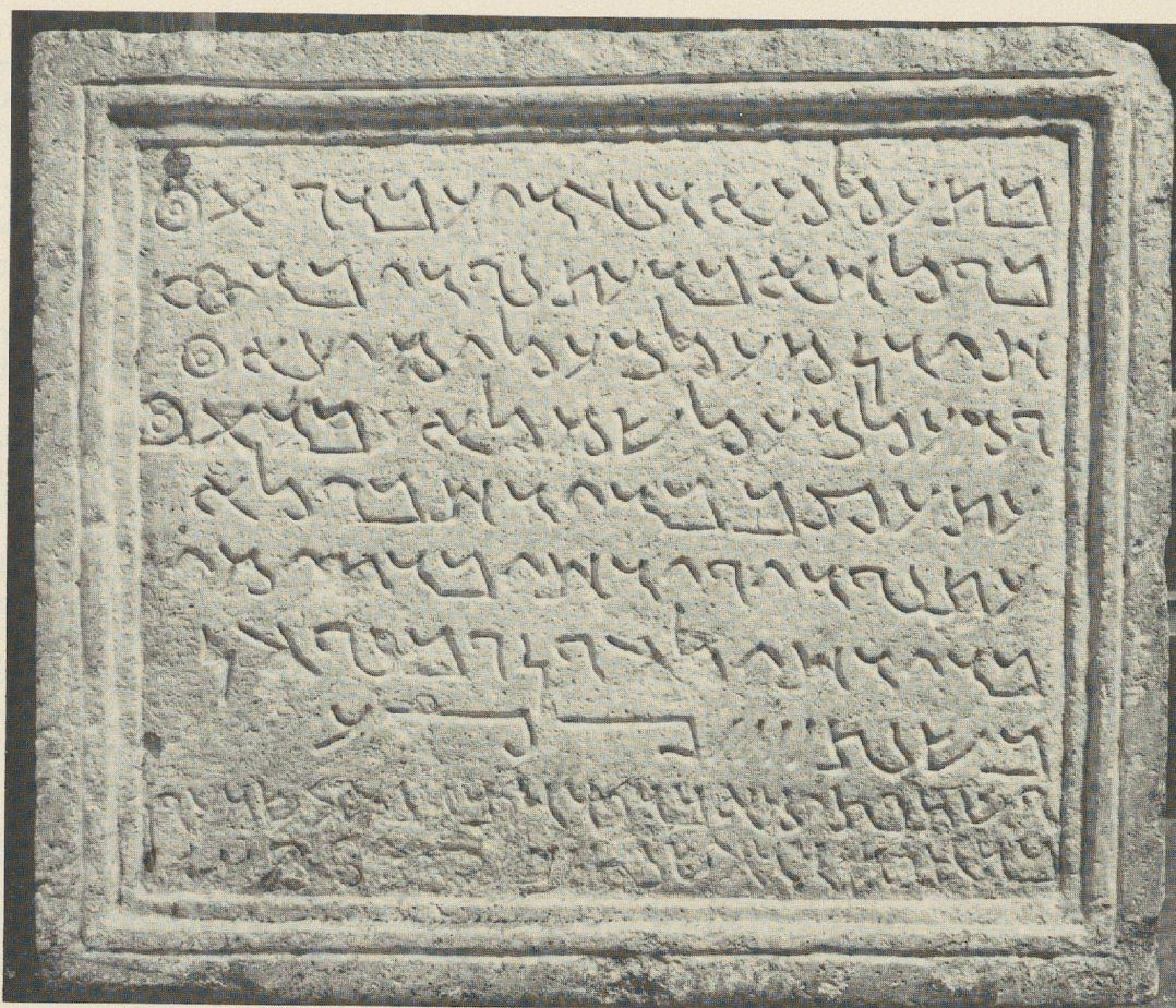
Fig. 1. Inscription palmyrénienne, texte de fondation d'un caveau funéraire.

associe à la part qui lui revenait de droit — comme le spécifiait la ligne 7, LHWN WBNWHN: «pour eux et leurs fils» — son cousin germain Shiméon, qui n'était pas descendant direct d'un des fondateurs. Pour légitimer sa participation, il fallut donc mentionner cet acte d'association dans l'inscription rajoutée d'une main plus hâtive une trentaine d'années plus tard.