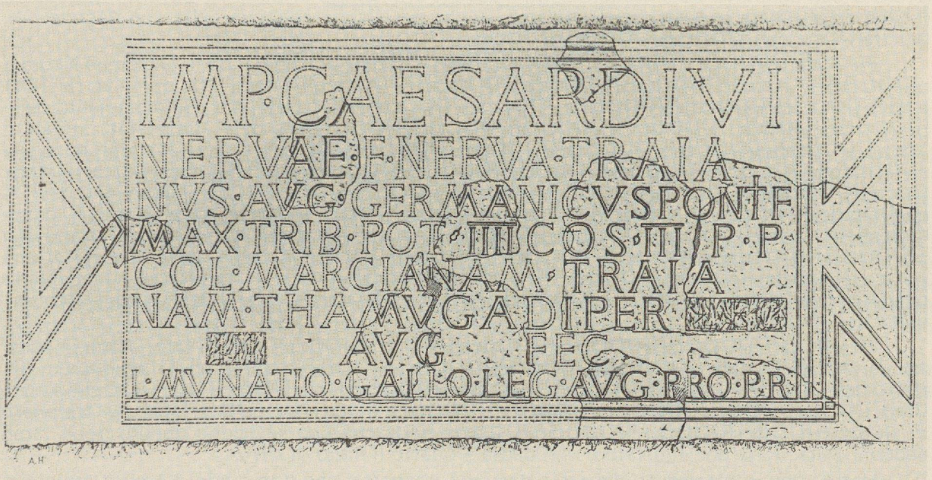
Fig. 3: L'iscrizione della porta settentrionale di Timgad.

volume dedicato all'architettura romana nella collezione intitolata Architecture universelle 5 . L'autore pertanto afferma, contro le altrui opinioni, che l'arco «era ben inserito nella pianta d'insieme della città» e va perciò attribuito al fondatore di questa.