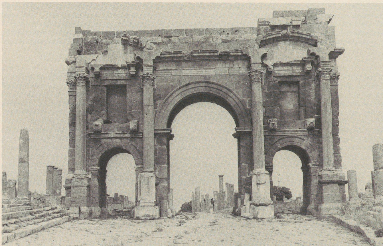
Fig. 1: L'arco «di Traiano» di Timgad.

149: ricomposta essa doveva avere una lunghezza di almeno 8 metri e doveva essere situata sopra l'altra faccia della porta, che nel suo complesso misura una lunghezza di m. 13,25.