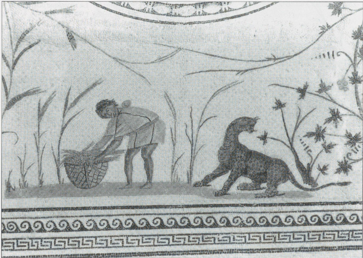
Fig. 7 La mosaïque de La Chebba. Un moissonneur de blé et une panthère.