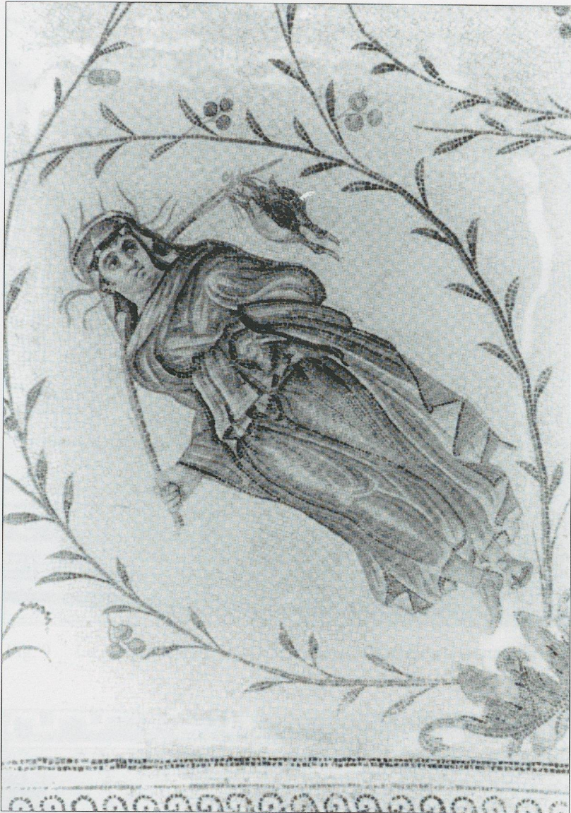
Fig. 5 La mosaïque de La Chebba. L'Hiver.