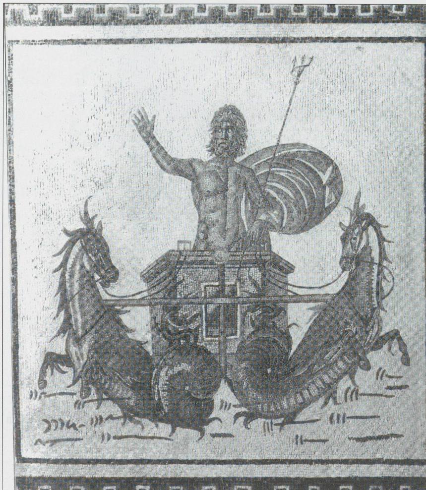
Fig. 10 La mosaïque du triomphe de Neptune de la Maison du Triomphe de Neptune d'Acholla.