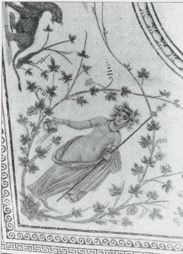
Fig. 4 La mosaïque de La Chebba. L'Automne.