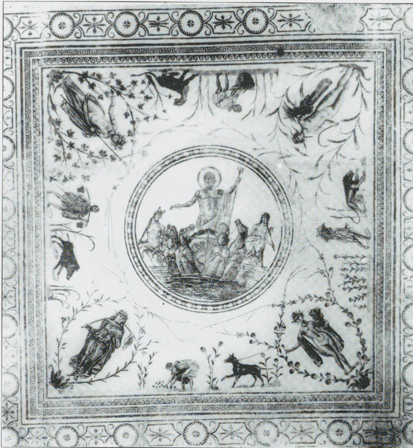
Fig. 1 La mosaïque de La Chebba. Vue d'ensemble.