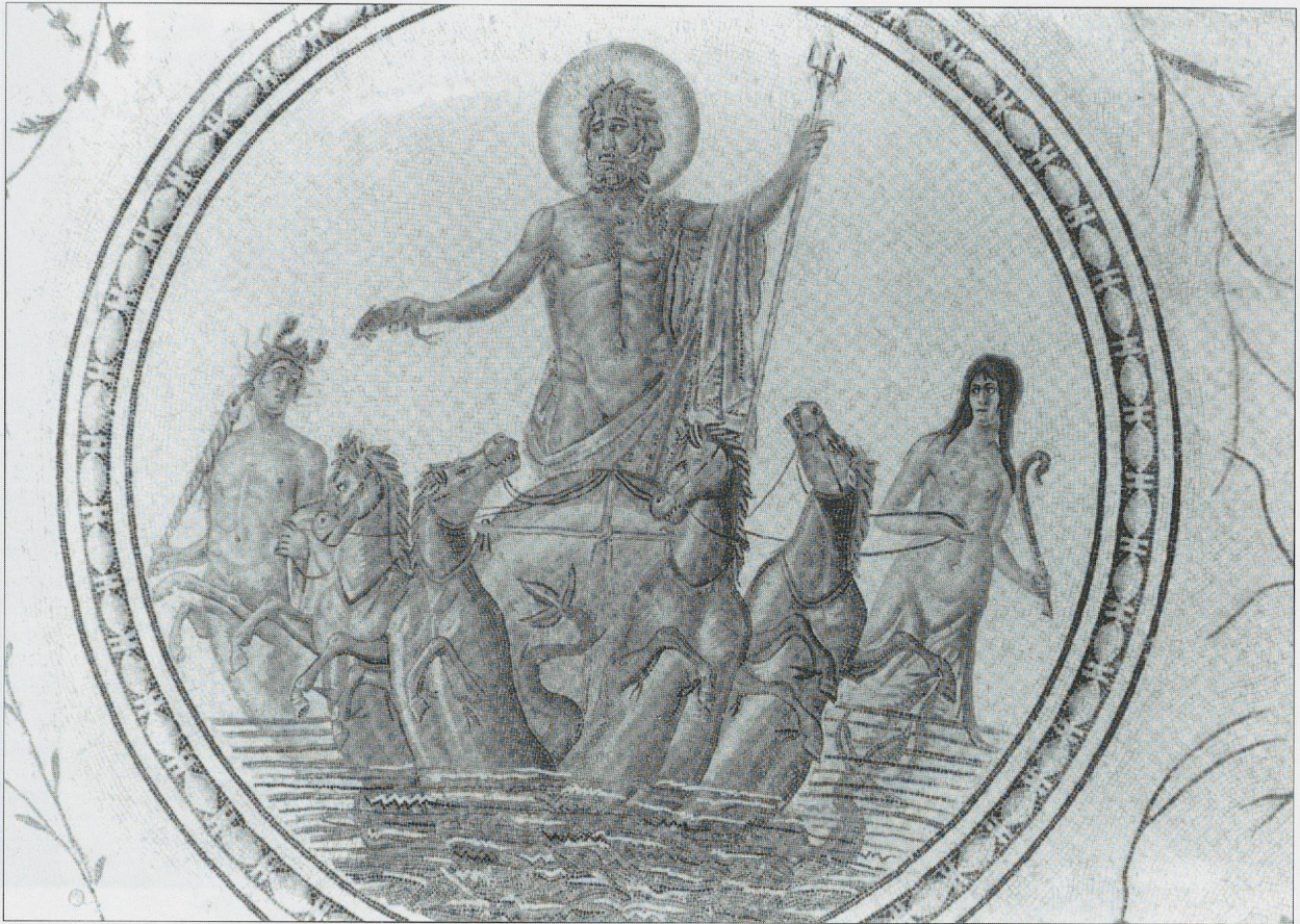
Fig. 9 La mosaïque de La Chebba. Le médaillon central avec Neptune.