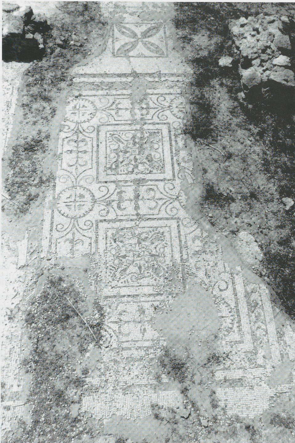
Fig. 13 La mosaïque du cubiculum XXVII de la Maison du Triomphe de Neptune à Acholla.