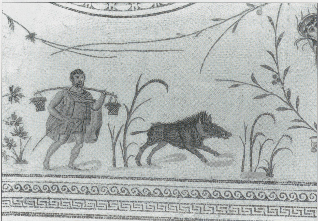
Fig. 8 La mosaïque de La Chebba. Un homme portant deux paniers et un sanglier.