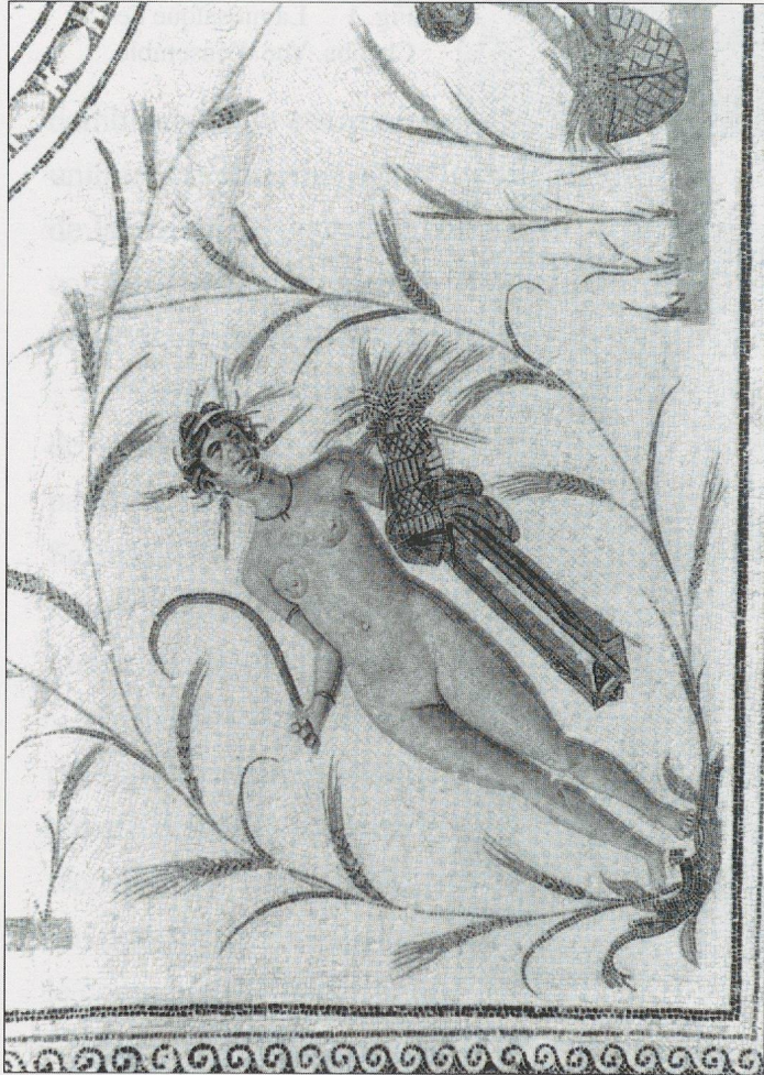
Fig. 3 La mosaïque de La Chebba. L'Été.