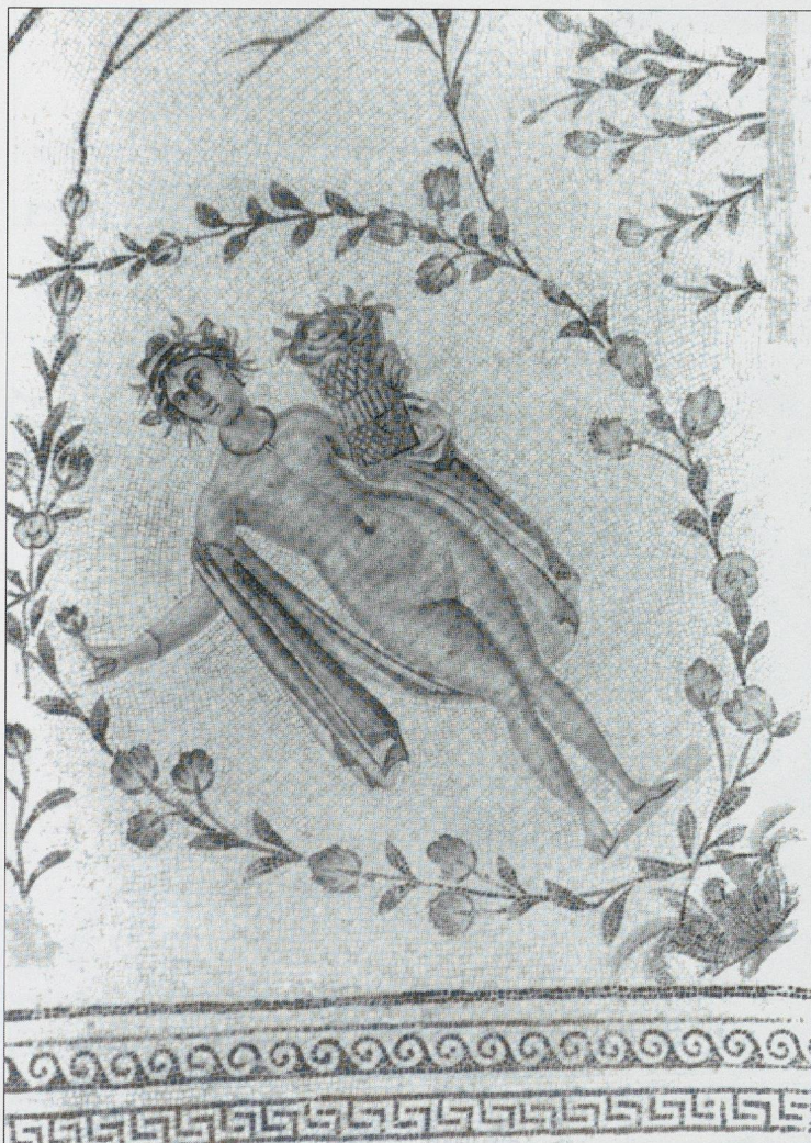
Fig. 2 La mosaïque de La Chebba. Le Printemps.