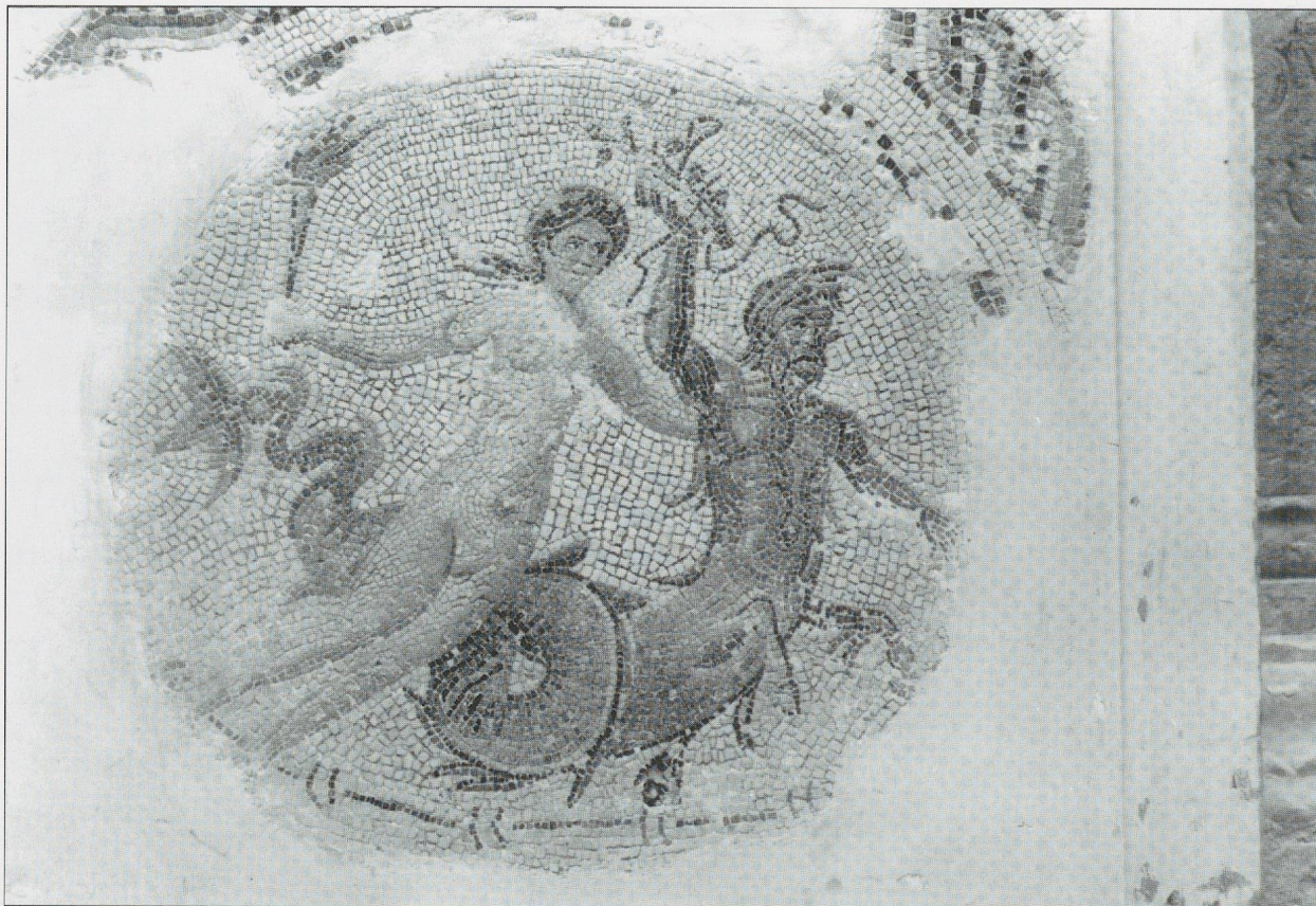
Fig. 11 Une mosaïque avec un triton et une néréide de la Maison du Triomphe de Neptune d'Acholla.