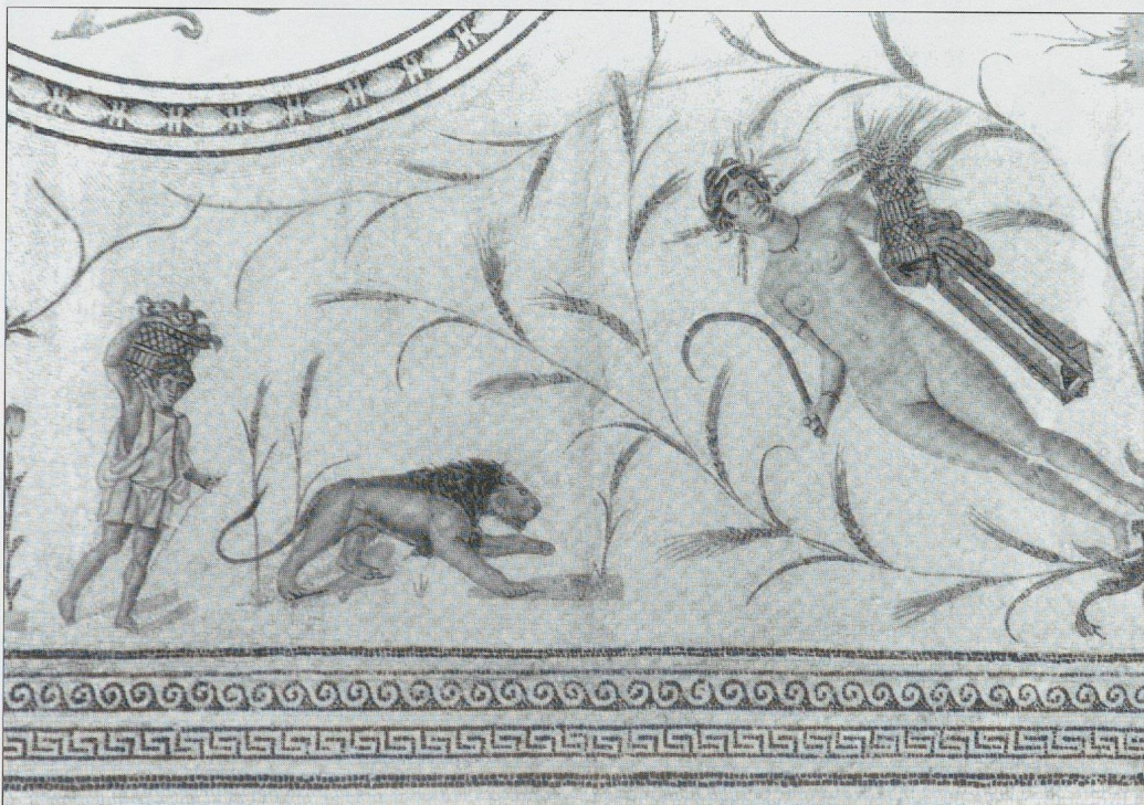
Fig. 6 La mosaïque de La Chebba. Un moissonneur de roses et un lion.