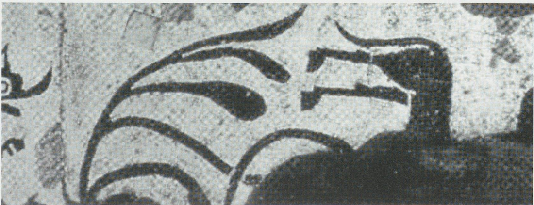
Fig. 4 - Reggio Emilia, Museo Civico : centauro (?).