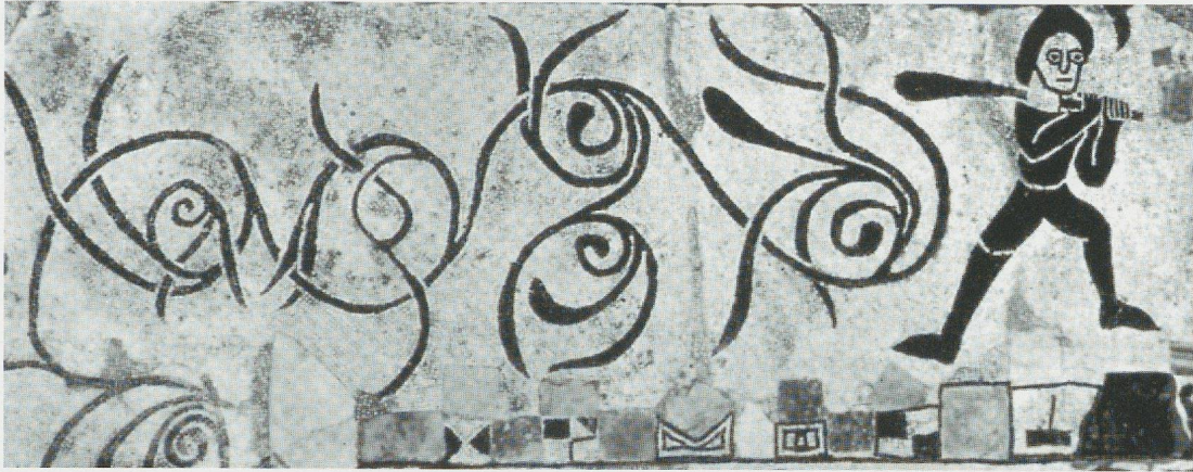
Fig. 2 - Reggio Emilia, Museo Civico : Ercole con la clava.