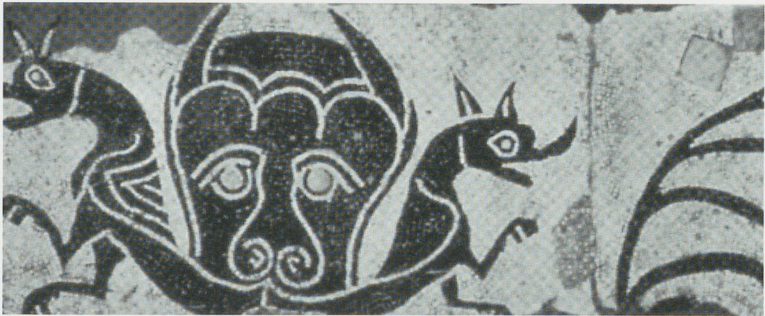
Fig. 3 - Reggio Emilia, Museo Civico : mostro tricorpore (Gerione).