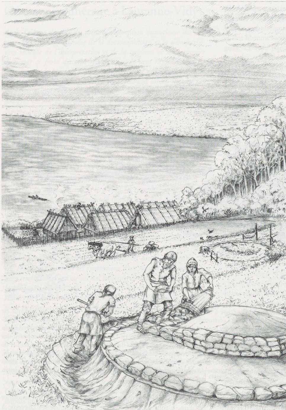
Fig. 164. Lausanne-Vidy (VD) Musée romain. Restitution du tumulus recouvrant la St38. Le fossé circulaire et la ceinture de blocs sont des éléments observés, la structure interne et l'élévation du terre n'est pas connue avec précision, mais les observations montrent qu'un parement interne non circulaire existe à quelques mètres à l'intérieur du fossé. Le bûcher, à droite, ainsi que le village sont totalement imaginaires. Ce dernier se situe plus ou moins à l'emplacement ou dans la direction présumée d'une des stations lacustres proches de la nécropole (Vidy-Les Pierrettes, Kaenel et Klausener 1990). Les zones défrichées à l'arrière-plan symbolisent les occupations de Morges (VD). (dessin Max Klausener, MHA VD).

un long couteau de bronze, et dont il recueillit le sang, dans un vase à large embouchure. Avec deux aides, il écorcha les dépouilles et préleva soigneusement la graisse, qui servit à recouvrir la défunte, afin de faciliter la combustion du corps : son âme pourrait alors s'élever comme une vapeur. Puis notre chef mit le feu au grand bûcher et désigna un officiant pour le surveiller pendant la nuit, alors que d'autres s'affairaient autour des animaux sacrifiés. Leurs membres furent coupés en premier, puis la viande fut débitée en morceaux et déposée sur les pierres déjà brûlantes du foyer. Une dizaine d'enfants recouvrirent le tout de combustible et de terre. Les cuisseaux seraient brûlés en offrande aux dieux. Mais le feu ne prenait toujours pas au bûcher funéraire, alors notre chef adressa une longue supplique à la bise du nord et lui promit de belles offrandes. Finalement, elle se leva et attisa de hautes flammes.