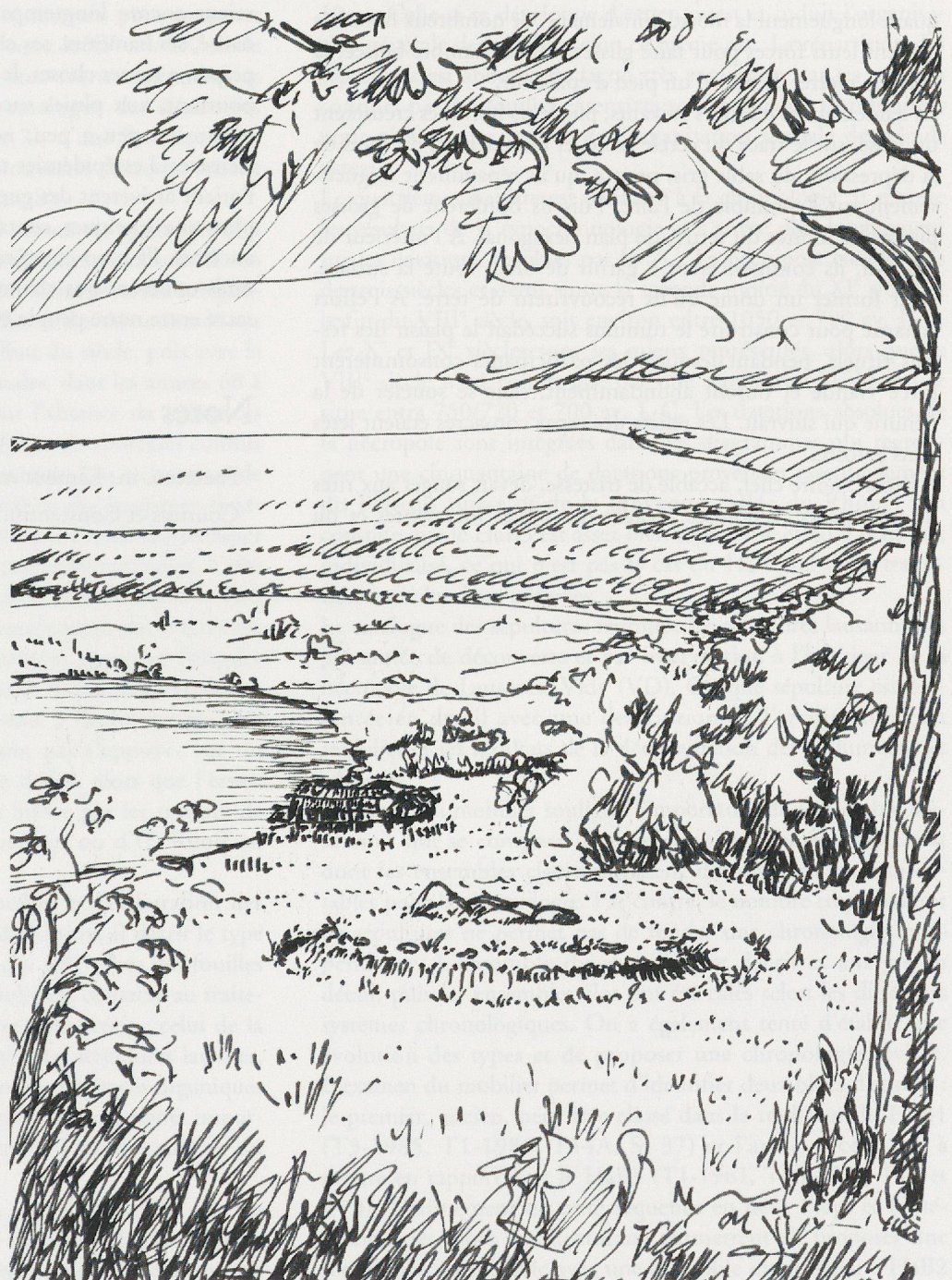
Fig. 165. Lausanne-Vidy (VD) Chavannes 11, la structure 111 entourée de son fossé circulaire. On distingue le fossé circulaire et quelques dalles situées sur l'incinération centrale. Même cadre que pour l'illustration précédente (voir légende de la fig. 164, dessin Max Klausener, MHA VD).

Après une nuit de festin, de liesse et d'histoires partagées, le bûcher n'était plus qu'une épaisse couche de cendres et de braises, que l'officiant arrosa pour éteindre les derniers brandons. Il recueillit les os blanchis, en prenant soin de les distinguer du reste des vestiges carbonisés, les lava soigneusement, avec de l'eau lustrale, et les déposa dans une petite urne basse, qu'il ferma avec un couvercle orné, à anse sur le sommet. Le reste des esquilles brûlées, mélangées à des cendres, et l'épingle de bronze doré, cassée en quatre fragments, et soudain dérisoire, furent mis dans un coffre de bois plat, que l'officiant déposa sur le fond du caveau. Il disposa, au-dessus, l'urne et une écuelle d'eau pure. Celle-ci était joliment décorée d'un motif incrusté