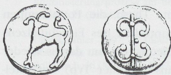
Abb. 3: Umzeichnung einer Potinmünze vom Zürcher Typ. M. 1:1.

1877 fanden sich anlässlich der Ausgrabung eines Kanals für die städtischen Wasserwerke am rechten Ufer des Flusses beim Letten (Stadtteil Wipkingen) vier stabförmige sowie ein doppel-