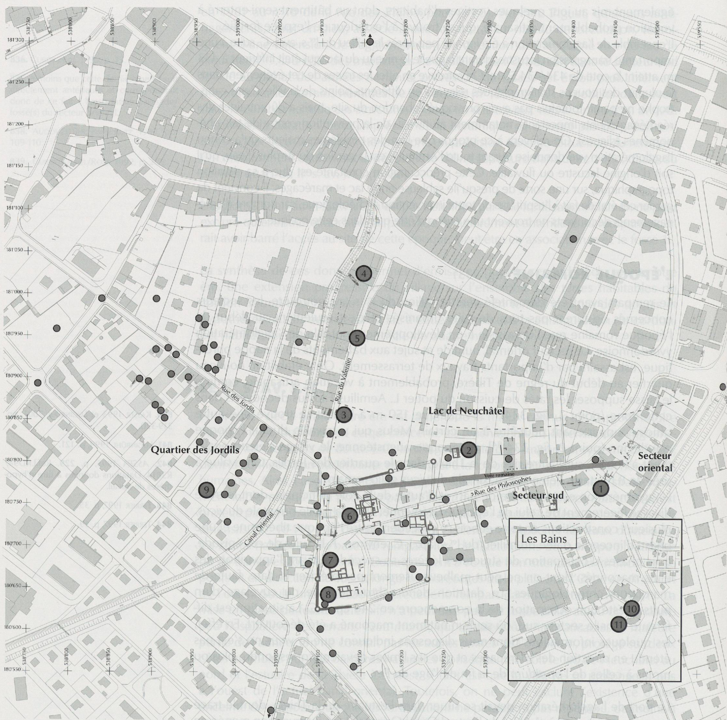
Fig. 334. Plan des interventions archéologiques ayant livré des vestiges d'époque romaine. D'après Reymond 2001. (Les chiffres renvoient aux interventions mentionnées dans le texte).