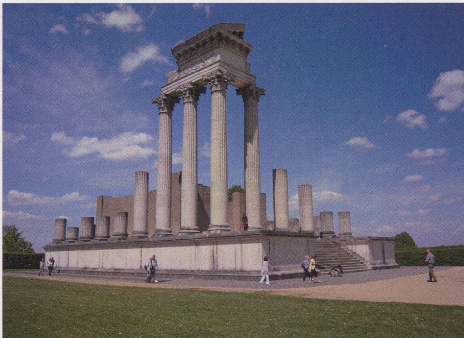
Fig. 4 — Xanten, parc archéologique, le temple du port.

relativement peu étendue, sont en effet visibles sous une dalle de verre; mais un élément essentiel de cette véritable scénographie est le mur de fond du pavillon, sur lequel apparaissent les passages du texte de César relatifs au territoire qui deviendra celui d' Octodurus et aux peuples qui l'habitaient.